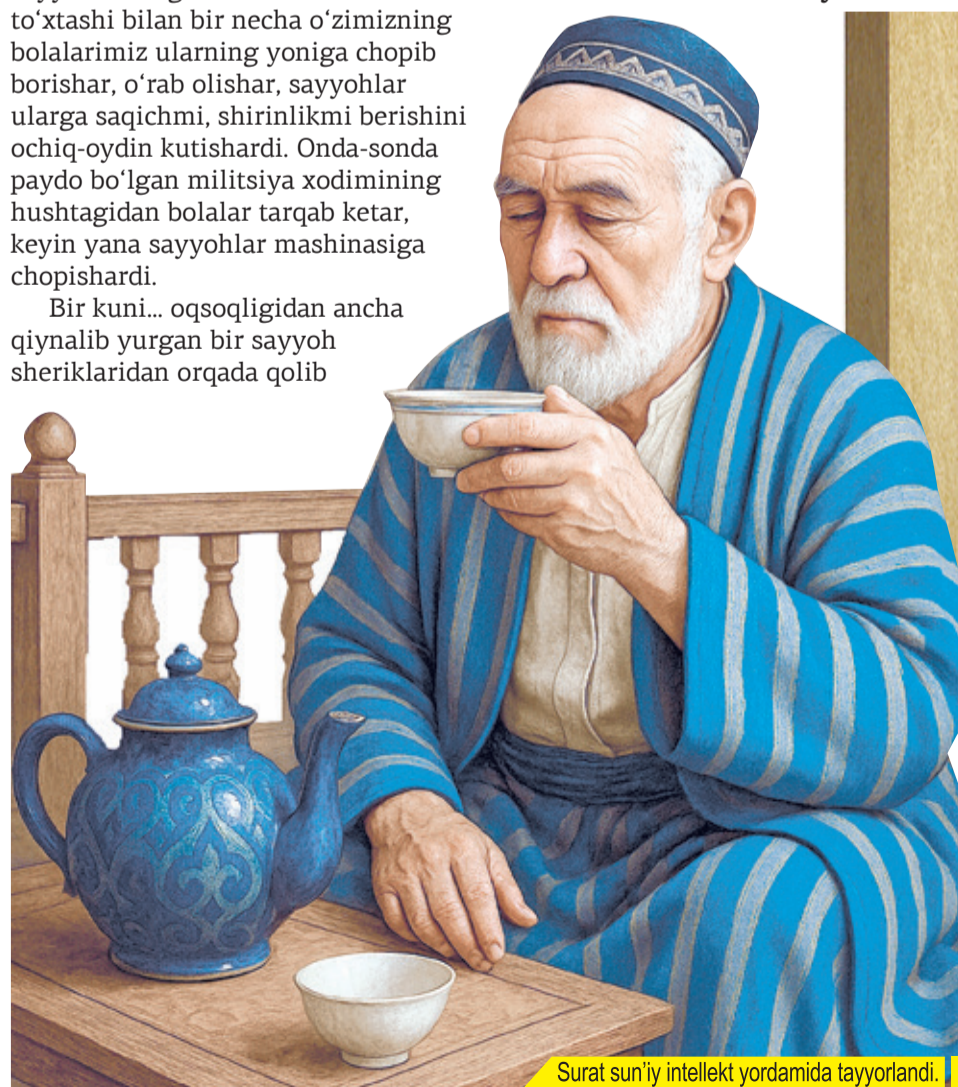
Surat sun'iy intellekt yordamida tayyorlandi.