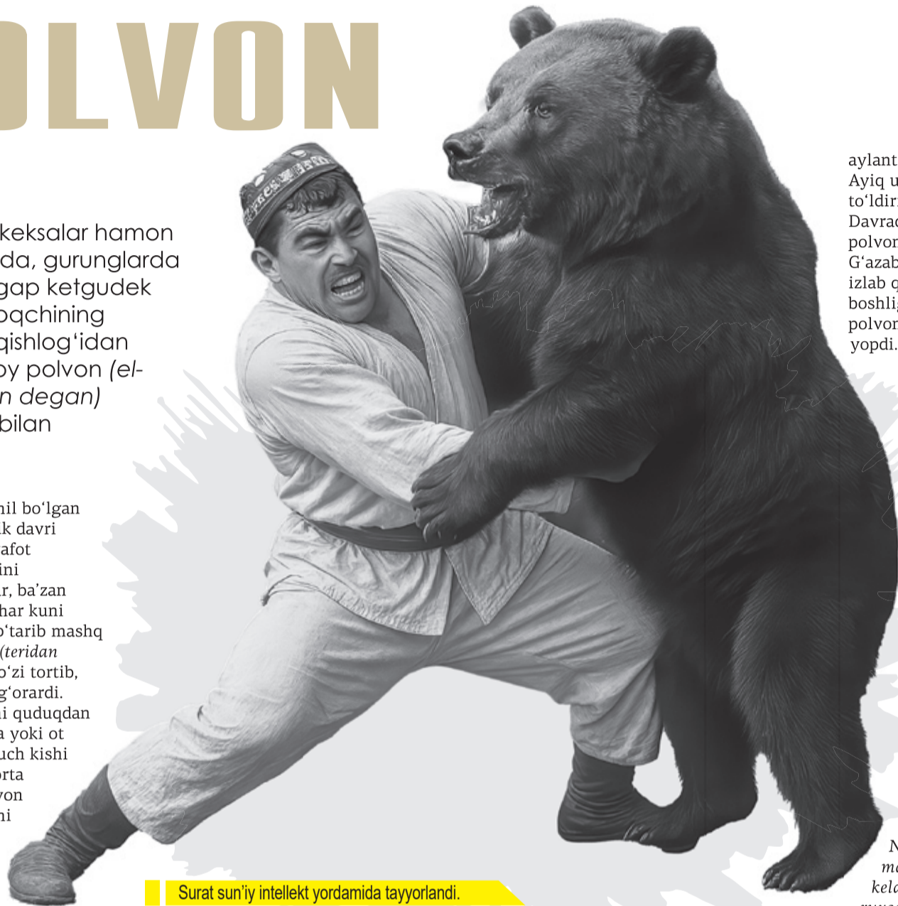
Surat sun'iy intellekt yordamida tayyorlandi.

Samarqandda yashaydigan Prisyann polvon ( asli kavkazlik ) To'la polvonning