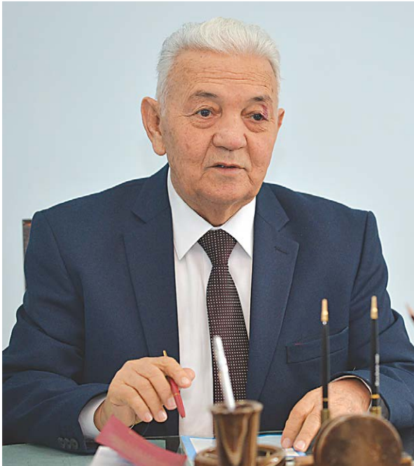
Убайдулла МИНГБОВ, Ўзбекистон Судьялар ассоциацияси раиси, Ўзбекистон Республикасида хизмат кўрсатган юрист.

Жамиятда инсон кадр-қимматини, барча соҳада қонун устуворлигини, адолат ва ижтимоий тенглик тамойилларини мустақамлаш мустақил ҳамда кучли суд ҳоқимиятини шакллантиришни тақозо этади. Истиқлолнинг дастлабки йиллариданоқ ушбу мақсад йўлида жиддий қадамлар қўйилди. Мамлакатимизда суд ҳоқимияти ва судьялар мустақиллигининг ҳуқуқий-ташкилий механизмлари яратилди. Тизим том маънода либераллаштирилиб, инсонпарварлик ғоялари билан такомиллашди. Судларни одамларни жазоловчи орган эмас, балки уларнинг қонуний манфаатлари ҳимоячисига айлантиришга бел боғланди. Ҳали жазосини бекор қилиш, «Хабеас корпус» институтини жорий этиш, адвокатуранинг ролини ошириш чора-тадбирлари одил судловни таъминлаш жараёнини жадаллаштирди.