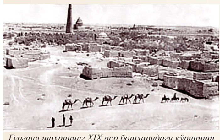
Гурганч шаҳрининг XIX аср бошларидаги кўриниши

X-XII юз йилликларда Хоразм, бизнинг кўз ўнгимизда, бир томондан, Халифалик мамлакатлари билан иқтисодий алоқаларни юзага келтирувчи марказ, бошқа томондан, Ғарбий Сибирь ва Шарқий Европанинг беадад кенгликларидеги давлатларни ўзаро бирлаштириб турувчи ўлка сифатида ҳам намоён бўлади. Хоразм шаҳарлари, айниқса, феодаллик давригача мамлакатнинг пойтахти вазифасини бажарган Кат шаҳрини иккинчи планга су-