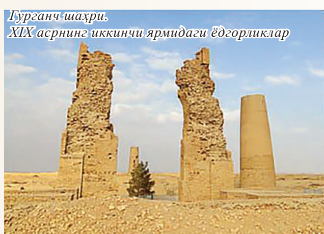
Гурганч шаҳри. XIX асрнинг иккинчи ярмидаги ёдгорликлар

X-XII юз йилликларда Хоразм, бизнинг кўз ўнгимизда, бир томондан, Халифалик мамлакатлари билан иқтисодий алоқаларни юзага келтирувчи марказ, бошқа томондан, Ғарбий Сибирь ва Шарқий Европанинг беадад кенгликларидеги давлатларни ўзаро бирлаштириб турувчи ўлка сифатида ҳам намоён бўлади. Хоразм шаҳарлари, айниқса, феодаллик давригача мамлакатнинг пойтахти вазифасини бажарган Кат шаҳрини иккинчи планга су-