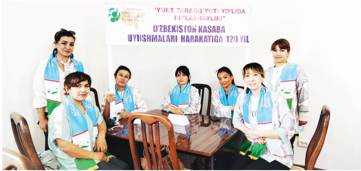
«YURT TARAQQIYOTI YO'LIDA BIRLASHAYLIK!» ЎZBEKISTON KASABA UYUSHMALARI HARAKATIGA 120 YIL

Ўзбекистон касба уюшмалари Федерациясининг Самарқанд вилояти кенгаши ташаббуси билан «Заковат» интеллектуал ўйини ўтказилди.