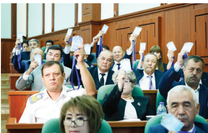
Ишчи-ходимлардан 5778 нафарига санаторийларга йўлланмалар ажратилди.

Салкам 12 минг нафарга яқин ёш ишчи-ходимга касаба уюшмалари кўмиталари томонидан моддий ёрдам ажратилди.