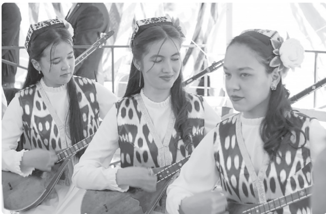
Маҳаллада ишлаш учун фақат билим эмас, одамлар билан мулоқот қилиш, тинглаш, сабр ва меҳр керак экан. Буни кун сайин ўрганаёман.

Бугунги кунда маҳаллаларда ёшлар билан олиб борилаётган ишлар нафақат сонига, балки сифатига қараб баҳоланмоқда. Шаҳрисабз шаҳридаги 38 та маҳаллада амалга оширилган "Ёшлар баланси" ташаббуси орқали йигит-қизлар ҳаётини, муаммоларини ва орзу-умидларини чуқурроқ ўрганишга эришдик. Бу — ҳақиқий таянч нуқта, халқ ичидаги ишончни мустаҳкамлашга хизмат қилувчи муҳим қадамдир.