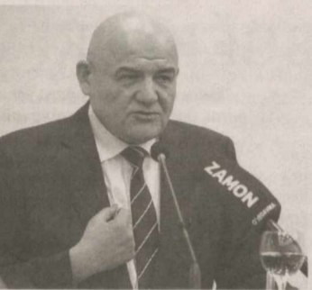
Муртазо РАХМАТОВ, иқтисод фанлари доктори, Ўзбекистонда хизмат кўрсатган иқтисодчи, Олий Мажлис Сенати аъзоси.

Ўзбекистон замини тарихда буюк Уйғониш даврларига бешик бўлган. Дунё илм-фани ривожига улкан ҳисса қўшган, улуг мутафаккирларни етиштириб берган ҳам бугун Учинчи Ренессанс пойдеворини қураётган Янги Ўзбекистонимиз заминидир. "Янги Ўзбекистон" ва "Учинчи Ренессанс" сўзлари ҳаётимизда ҳудди эгизаклардек бир-бирига уйғун ва ҳамоҳанг бўлиб янграб турибди. Халқимизни улуг мақсадлар сари руҳлантирмоқда.