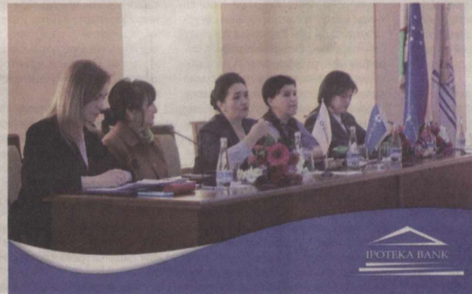
Реклама хуқуқи асосида

Жамиятимизда гендер тенглик сиёсати устувор масалага айланди, аёл ва эркекларнинг тенг имтиёзлар асосида ўз имкониятларини тўлақонли рўёбга чиқаришлари учун зарур шарт-шароитларни яратиш давлат сиёсати даражасига кўтарилди.