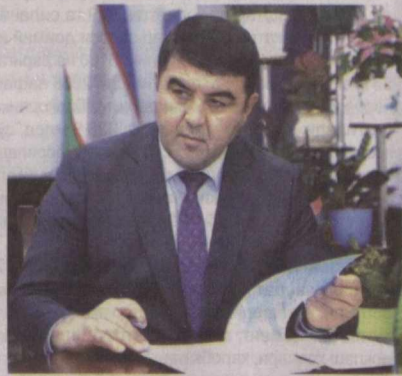
• Шавкатжон АБДУРАЗЗОҚОВ, Наманган вилоят ҳокими, Ўзбекистон Республикаси Олий Мажлиси Сенати аъзоси.

Байрам тантаналари давом этмоқда. Назокат УСМОНОВА, ЎЗА мухбири.