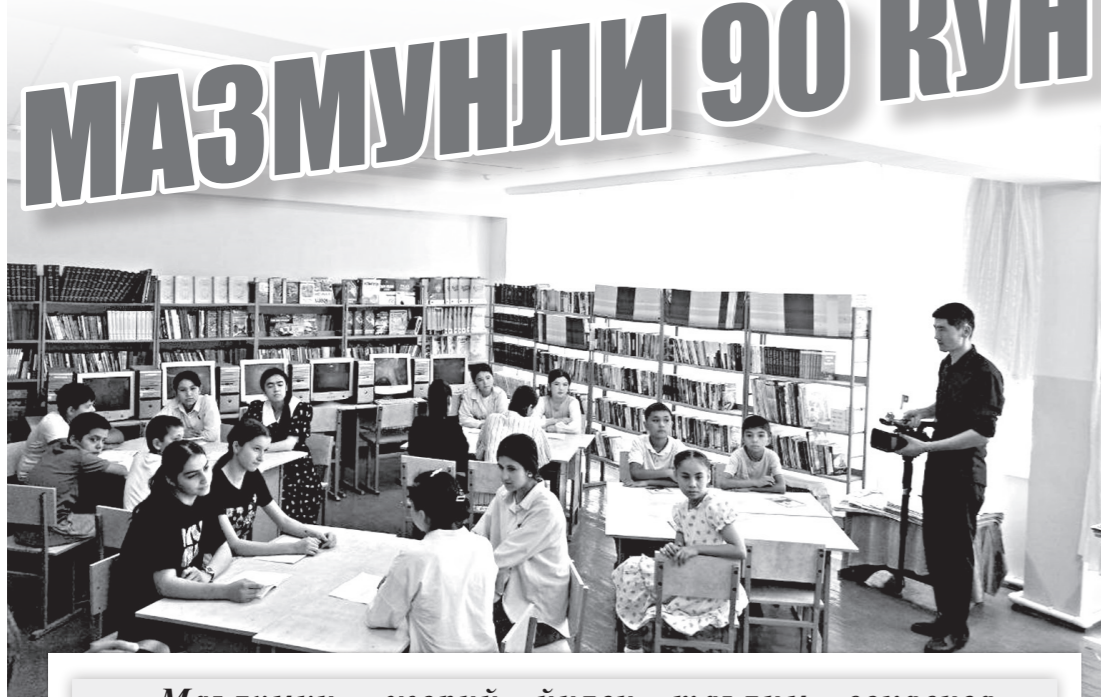
Маълумки, жорий йилги таълим соҳасига базишланган видеоселектор йиғилишида Президентимиз томонидан ўқувчи-ёшларнинг ёзги таътилини мазмунли ўтказиш учун маданий-маърифий, спорт ва ижодий тадбирларни ташкил этиши бўйича аниқ топшириқлар берилган эди.