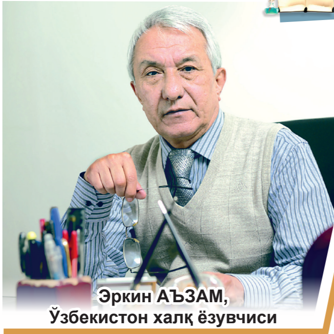
Эркин АЪЗАМ, Ўзбекистон халқ ёзувчиси

"Инсон номи мағрур жаранлар!" деган эди Максим Горький. Баландровозроқ йўсинда айтилган бўлса-да, йўқсиллар куйчисининг бу таърифи айти ҳақиқат. Бироқ биз, хом сут эмганлар ана шундай муътабар маснад бу ёқда қолиб, кўпинча, маврид-бемаврид ўткинчи мансабу мартабаларимизни пеш-писанда қилмоққа ошиқамиз. Ишонмасангиз, газеталарга бир назар ташланг - шопалоқдеккина матнинг остида ё устида гоҳо ундан-да мўлроқ ўрин эгаллаган қатор-қатор унвону замма! Айниқса, таъзияномаларни айтинг. Ўлган - бир одам (Худо раҳмат қилсин), қолган мусибатдорнинг бор мансабу унвонлари кўша-кўша