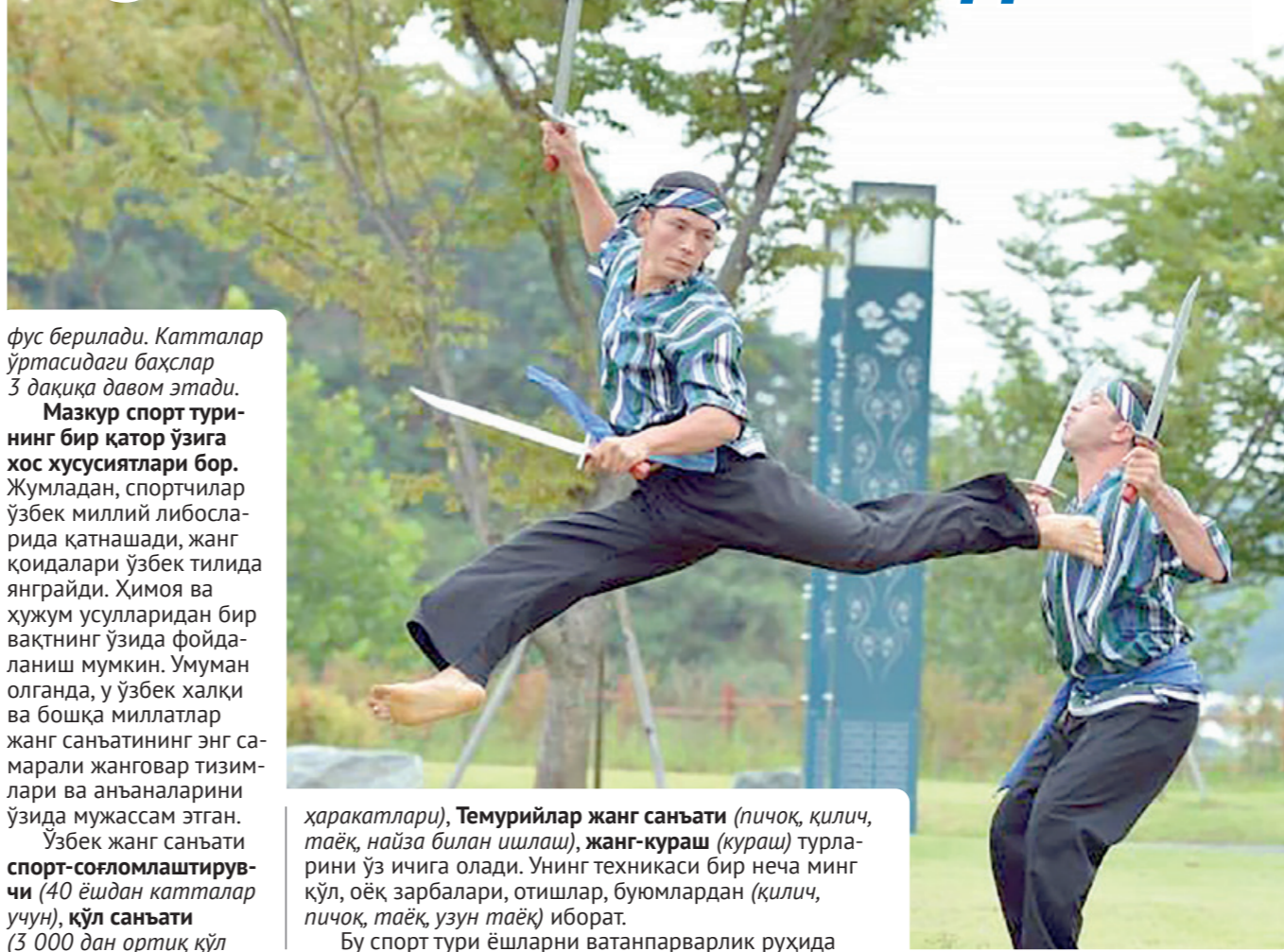
фус берилади. Катталар ўртасида баҳслар 3 дақиқа давом этади.

Мазкур спорт турининг бир қатор ўзига хос хусусиятлари бор. Жумладан, спортчилар ўзбек миллий либосларида қатнашади, жанг қоидалари ўзбек тилида янграйди. Ҳимоя ва ҳужум усулларида бир вақтнинг ўзида фойдаланиш мумкин. Умуман олганда, у ўзбек халқи ва бошқа миллатлар жанг санъатининг энг самарали жанговар тизимлари ва аъёнларини ўзида мужассам этган.