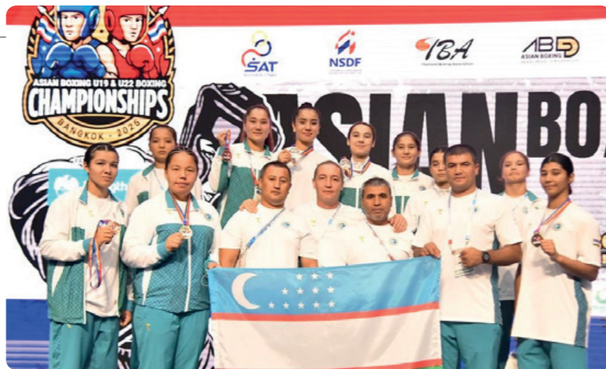
Ўзбекистон U19 терма жамоаси бокс бўйича ОСИЁ ЧЕМПИОНАТИДА БИРИНЧИ ЎРИННИ ЭГАЛЛАДИ.

Ўзбекистон U20 қизлар терма жамоаси Таиландда бўлиб ўтадиган ОСИЁ КУБОГИДА ИШТИРОК ЭТАДИ.