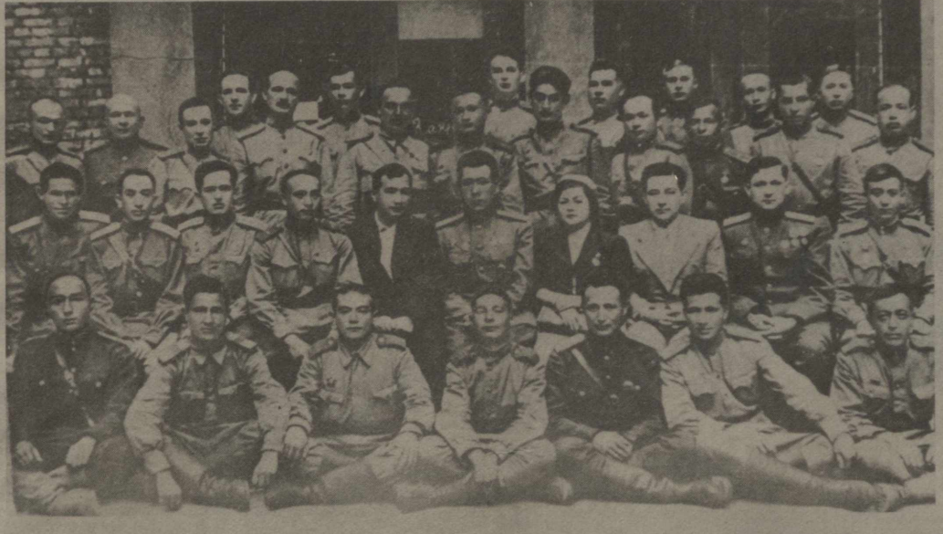
Ўзбекистондан борган делегация вакиллари генерал Собир Раҳимов (ўртада) ва бошқа ўзбек жангчилари даррасида. 1943 йил 4 август.

Совет халқи Гитлер фашизми устидан қозонилган тарихий ғалабанинг 40 йиллиги олдидан катта тавбёрлик ишларини бошлаб юборди. Улуғ ғалабанинг юбилейига тавбёрликни бутун ғоявий-тарбиявий ишчи кучайтиришга кўмаклашим керак.