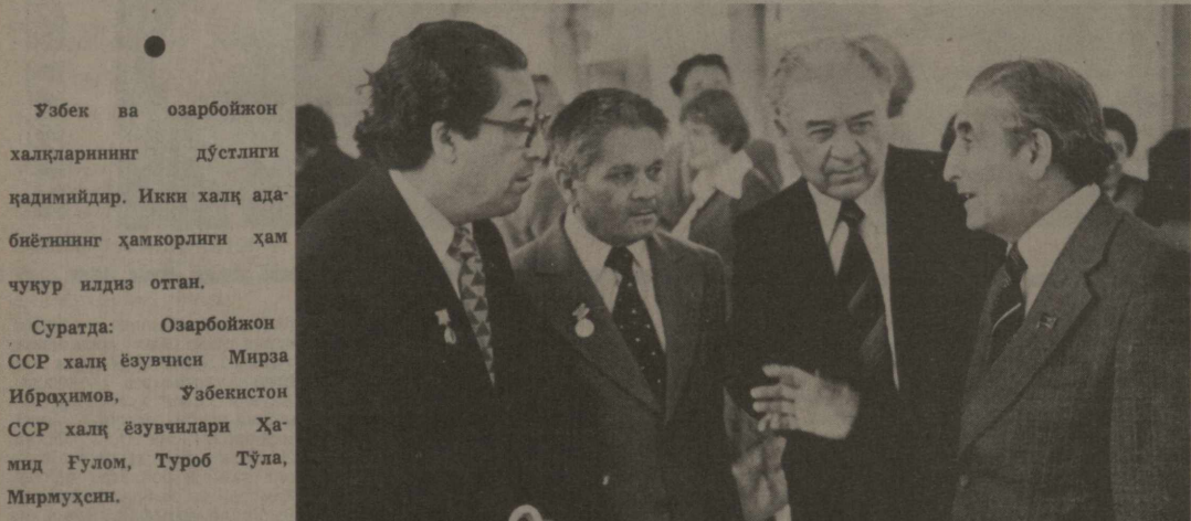
Ўзбек ва озарбойжон халқларининг дўстлиги қадимийдир. Икки халқ адабиётининг ҳамкорлиги ҳам чуқур илдиз отган.

Ўзбекистондаги ҳаётнинг ҳақиқатлари. Ўзбекистондаги ҳаётнинг ҳақиқатлари. Ўзбекистондаги ҳаётнинг ҳақиқатлари.