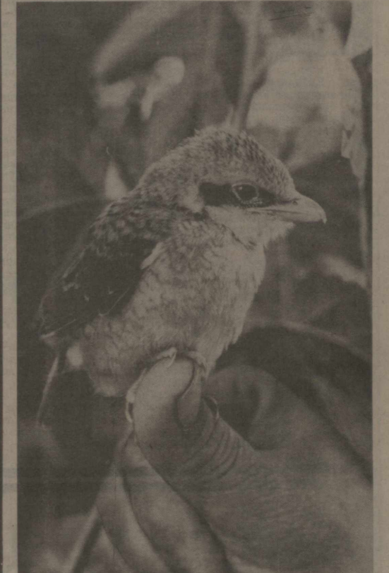
ҚУШЛАР — БИЗИНГ ДУСТИМИЗ.