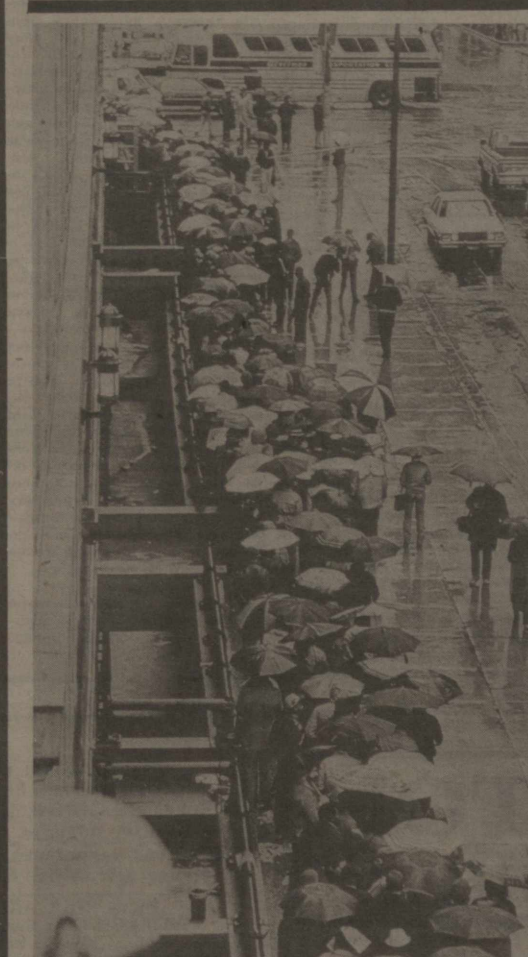
Миллионлаб америкаликлар ҳамон меҳнат қилиш ҳуқуқидан маҳрум. Меҳнат министрлигининг маълумотида қараганда «ортиқча одамлар» армияси айрив айрив 70 минг кишига етмоқда. Малакатида умумий ишчилар сонини эса 8,8 миллиондир. «Индустриал уик» журналидан олинган бу суратда кучли ёмғир бўлишига қарамай иш сўраб навбатда турганлар асқ этиляптилар. ТАСС фотохроникаси.

Ҳабибулла Олимжоннинг «Тақдир тақозоси» ривисидида инсон, севи, ҳаётда ўз ўрнини топиш учун кураш ҳақида ҳикоя қилди. Тақдир тақозоси билан бу тушунчалар инсонда ҳар хил кечилиши мумкин. Ийғит ва қиз ўртасидида тақдир тақозоси билан барбод бўлган севи, энди бошқа нарсалар ҳақида ҳам ўйлашга мажбур қилди. Қиссада инсонийлик мадҳ этилди.