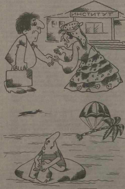
РАССОМ Ш. СЪҲОНОВ