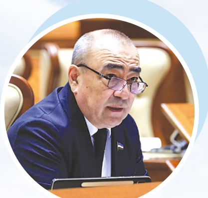
Ҳусан ЭРМАТОВ, Олий Мажлис Сенати аъзоси.

Айни шу талаблардан келиб чиқиб, Сенатнинг Фан, таълим ва соғлиқни сақлаш масалалари қўмитаси томонидан юқоридаги ҳужжат мутасадди идоралар, тегишли экспертлар билан атрофлича муҳокама қилинган, уни қабул қилишни рад этиш масаласи юзага чиқди.