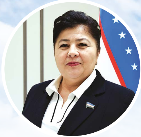
Сайёра АБДИКАРИМОВА, Олий Мажлис Сенати аъзоси.

Дарҳақиқат, 2024 йили Хоразмда "кичик ва ўрта бизнес йили" бўлди, дейиш мумкин. Ялпи ҳудудий маҳсулот ҳажми сезиларли даражада ортиб, иқтисодий фаолиятнинг барча йўналишларида ижобий ўсиш динамикаси қайд этилди. Саноатда ишлаб чиқариш ҳажми ортаётгани, қишлоқ хўжалигида барқарор ривожланиш, қурилиш соҳасидаги юқори суръат ва хизматлар кўламининг кенгайиши шулар жумласидан.