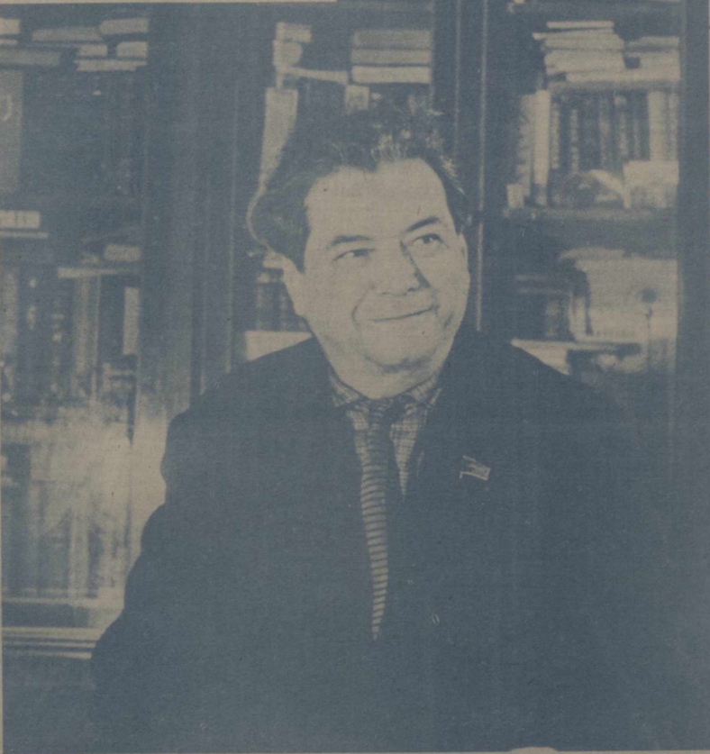
Ўзбекистон ССР халқ ёзувчиси Ойбек