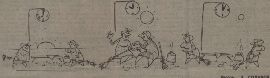
Рисом Х. СОДИҚОВ

Ҳурматли Рашид ака! Ме- на, сизга ваъда қилганимиз- дек, мактубингизга мактубот орқали жавоб йўлламоқдамиз. Мактубингизда сиз совхоз ва қурилишда қирқ уч йил ҳалол ишлаганингни, иш дав- рида темир интизомга амал қилганингни, ўттиз бир йил- лик партия шанингни деғони- да давлат ва халқ манфаат- ларини кўзлаб иш тутганингни байи этилган. «Мен, — деб азимсиз мактубда, — давлат мулкисини талон-тарож қил- ганларни фош этиб, махнат оттуксамини ҳам шу ишларга сераф этсаму, шунча меҳнат- тим, хизматим инобатга оли- май, яна жазога — шартли уч йиллик — ахлоқ тузатишга ҳук қилинсам.