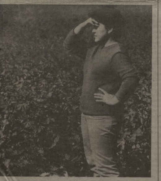
Бир тала пахта ҳам ерда қолмайди.

Чинакам ватанпарварлик намунасини кўрсатиб ишлаётган юзлаб оилавий зенелор, бригада ва бўлимлар аллақачон социалистик мажбурият ҳисобига ҳосил топиришмоқдалар. 55 минг тонналик юксак хирмон учун кураша-