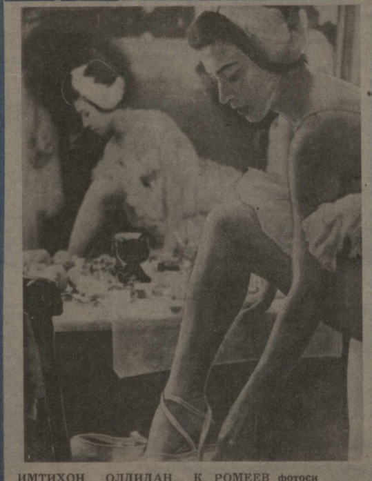
ИМТИХОН ОЛДИДАН...

Яширининг ҳўжати йўқ, баъзи санъаткорларимиз орасида фақат ўзини ўйлочини шахсиятларас кийилар ҳам учраб қолди. Муҳаббат опа жуда самийий, беғараз маслаҳатчи. Ҳеч кимдан ёрдамни аямайди. — Эстрада хонадаси сифатида бугунги ўзбек эстрадаси ҳақида нима дей оласиз? Бу жанрда ижод қилаётган композиторлар хусусинда филдингизни ҳам билмоқчи эдим. — Тўғриси, ўзбек эстрадасининг бугунги аҳволи мени қониқтирмайди. Республикамизда Булуғитиқоқ, Ҳўзир репертуарида кўп. мурадлар кўп. Бироқ томошабинлар оммаси уларнинг кўпини яхши танимайди. Ҳар ҳолда буни яқиний ўйлаб кўриш керак. Композиторларга келсан, Қаландаров, Милов, Ширьяев каби ижодкорларнинг иш услуби менга ёнади. Ҳўзир профессорларни ҳам номозиорларнинг кўнйатқалиги кўнвоқларди. Лекин бу ёшларнинг музича оламига кириб келишлари бирмунча қийин бўлипти. Масалан, истаълодди композитор Аваз Мансуровнинг «Музафиймоқ» кўшиқини ёиш учун икки ойдан ортиқ вақт сарфлаган. — Ҳўзир нималар устиде ишляяйсиз? — Яқин режаларимдан бири — Янги йилга яхши кўшиқ соғва қилиш. Буюк ғалабанинг 40 йиллигига беш кўшиқдан иборат туркум тайёрлашман. Уруш ҳақидаги бу кичик ҳўкионинг шеърларини В. Баграмов ёзган, Б. Милов музика