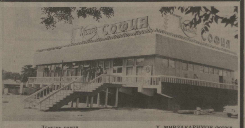
Дўстлик рамзи.