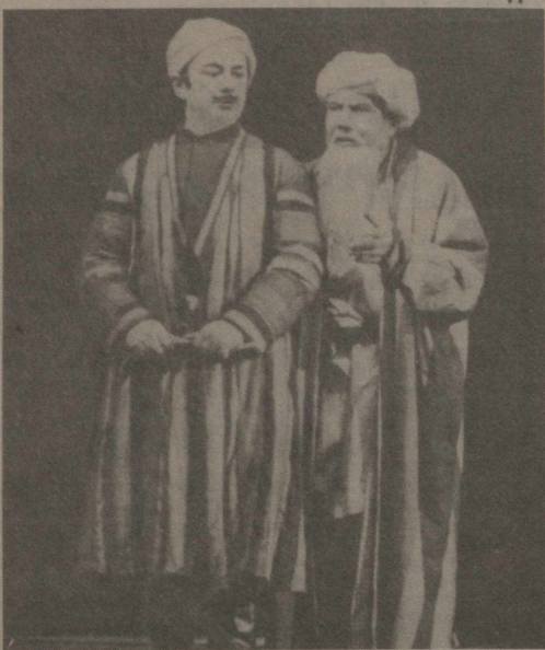
Суратда: «Шарқ тоғи» спектаклидан бир кўриниш.