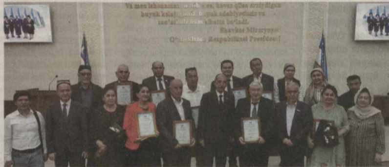
Шеърӣ учун рағбатлантирувчи ўринларни кўлга киритди.