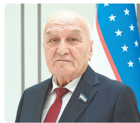
Икромхон НАЖМИДДИНОВ, Ўзбекистон Республикаси Сенати аъзоси, “Нуроний” жамғармаси Наманган вилояти бўлими бошлиғи.