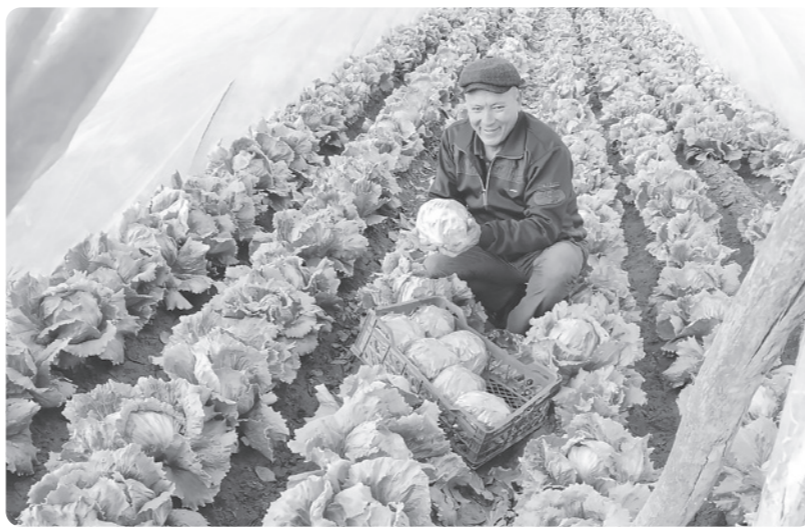
Мисол учун, “маҳалла еттилиги” кўмагида жорий йилнинг ўтган даври мобайнида 4,7 миллион нафар аҳоли даромадли меҳнатга жалб қилиниб, 2 090 та (23 фоиз) маҳалла ишсизликдан, ижтимоий шартнома асосида кўмак чораларини кўрсатиш орқали 302 мингта оила камбағалликдан чиқарилиб, 1 435 та (16 фоиз) маҳалла камбағалликдан хали худудга айлантирилди.

“Камбағалликдан фаровонлик сари” тамойили асосида ҳеч ким эътибордан четда қолаётгани йўқ. Маҳаллаларда уйма-уй юриб, фуқароларни камбағалликдан чиқариш чоралари кўриляпти. Бу жараёнда камбағал аҳолини шунчаки ишга жойлаштириш эмас, балки доимий иш ўринларини кўпайтириб, одамлар барқарор даромад манбасига эга бўлиши учун шарoит яратилляпти.