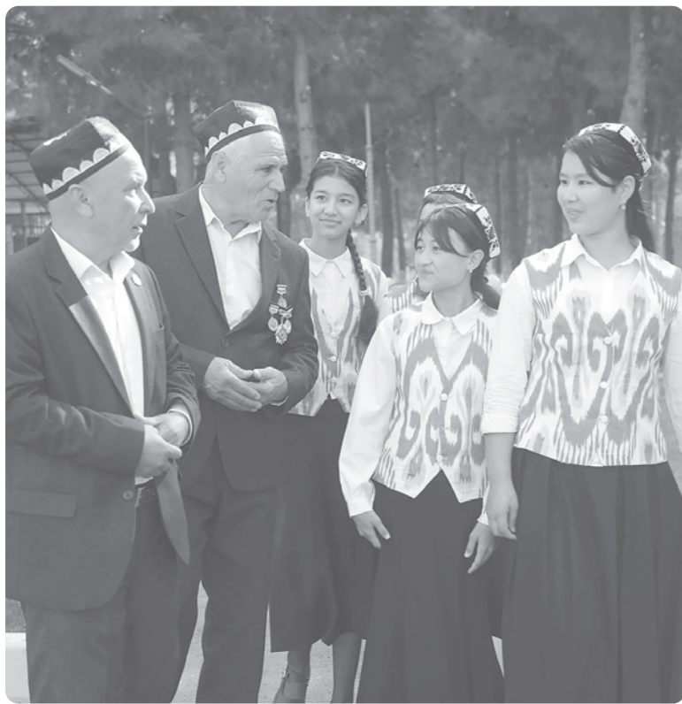
Давоми. Бошланиши 1-саҳифада.

Бугун нурунийларимиз ижтимоий ҳаётда фаол. Қайси бири ёшлар кўлидан етаклаб, уларни ҳаётда ўз ўрнини топишига кўмаклашаётган бўлса, яна бошқаси томорқаларда камбағал оила аъзоларига ер илмини, боғбонлик, деҳқончилик сирларини ўргатмоқда. Бошқа бири камбағал оилалар вакилларининг ҳаётини яхшилаш учун иш олиб бораётган бўлса, яна қимдир оилалардаги нотинч муҳитни соғломлаштиришга уринапти.