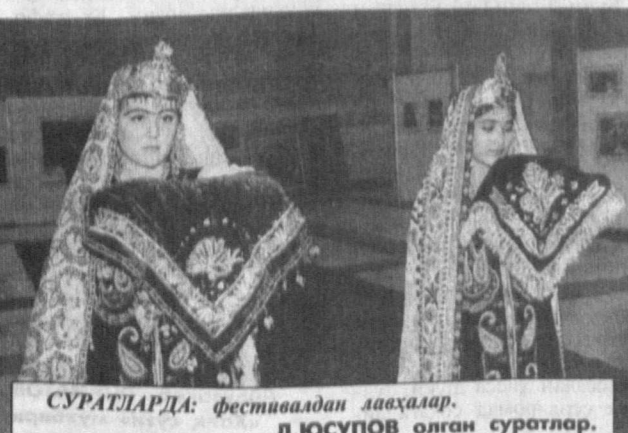
СУРАТЛАРДА: Фестивалдан лавалар.