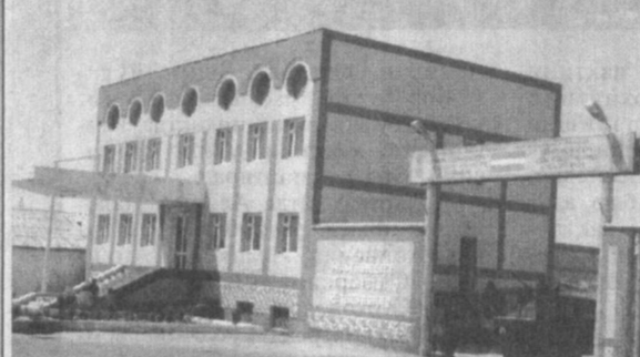
Наманган вилоятининг Янгиқўрғон туманида асосан мева-сабзавот ва галла етиштирилади. Ҳар йили 25 минг тоннага яқин дон 60-65 километр олинсадаги вилоят марказига ташиб келинади. Бу ҳол ортқича сарф-харажатларнинг ошиб кетишига сабаб бўлаётганлиги. Жорий йилда ана шу муаммо ҳал этилди: туманда дон қабул қилиш пункти қуриб битказилди.

Ҳўш, қандайдир аҳоли истиқомат қиладиган «Йўрмалар» маҳалласини марйонликлар чин маънода байналмиал маскан, деб аташди. Маҳалла ўрамини яшайдиган татарлар, тожиклар, қирғизлар, мексикети турклар, руслар ўзбеклар билан бирга бир оила фарзандидой, мустақил юртимиз равнақи йўлида ҳормой-толмай меҳнат қилишяпти. Яна маҳалла ҳақида гап кетса, збилилар маҳалласи ҳам, деб қўйишди. Чунки 550 нафардан ортқ олий маълумотли, 275 нафар ўрта махсус маълумотга эга бўлган, ўндан ортқ касб эгалари учун ҳам у муқаддас ошибди.