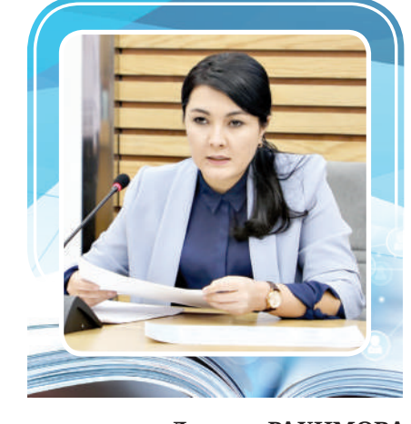
Дурдона РАХИМОВА, Тошкент шаҳар ҳокими ўринбосари

Шундан сўнг давлатимиз раҳбари раислигида Тошкент шаҳрини иқтисодий-иқтисодий жиҳатдан ҳар томонлама ривожлантириш, шаҳар муҳитини яхшилаш ва муносиб яшаш шароитини яратиш масалалари юзасидан йиғилиш ўтказилди. Унда, аввало, пойтахтда бажарилган ишлар