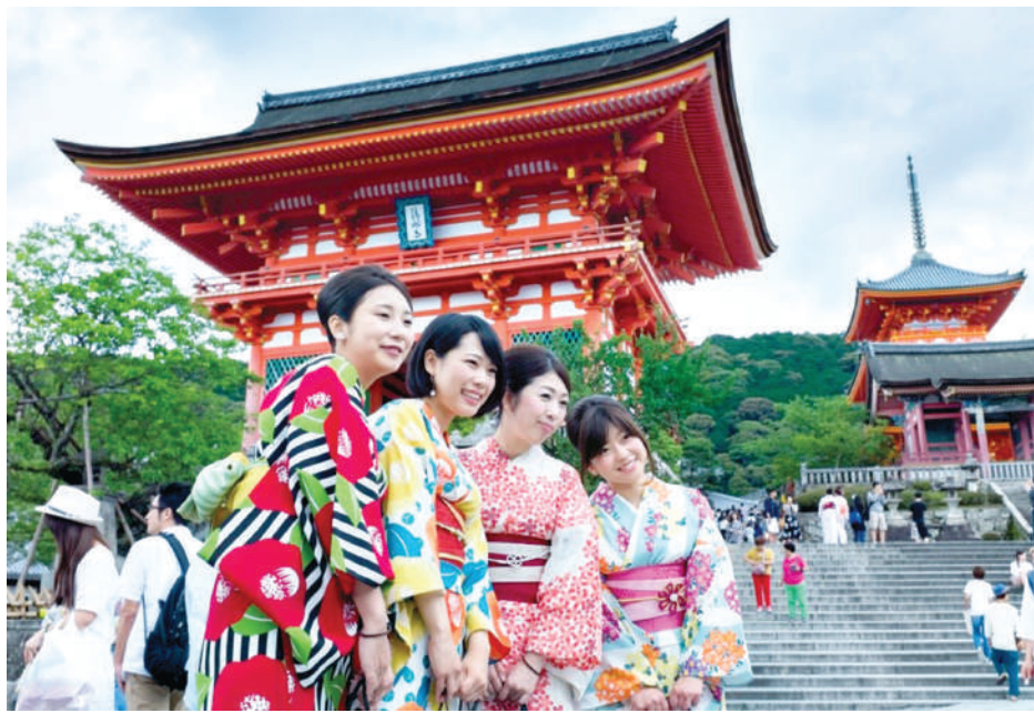
амалга оширилмоқда, бунинг натижасида товар айирбошлаш ҳажми сўнгги йилларда барқарор ўсишни намойиш этмоқда.