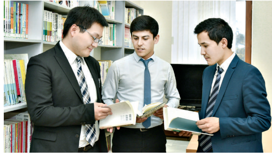
олий ўқув юртида 2,5 мингдан зиёд талаба япон тилини ўрганмоқда. Мамлакатда Япон ресурсларини ривожлантириш бўйича Ўзбекистон — Япония маркази, Япониянинг JDS стипендияли ривожланиш дастури, Токио, Нагоя, Цукуба, Кеё ва

агентлиги (JICA) билан миллий тиббиётни ривожлантиришда муҳим қадам бўладиган замонавий лойиҳа — Республика неврология ва инсульт марказини қуриш ва жиҳозлаш учун 150 миллион долларлик қарз битими имзоланди.