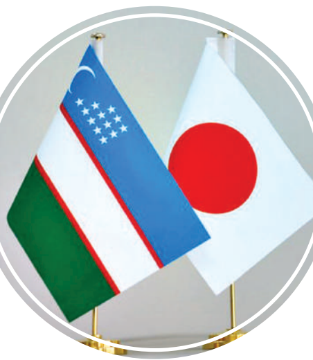
кимё, машинасозлик, логистика, таълим ва туризм соҳаларидаги 13 йirik компанияси ваколатхоналари аккредитациядан ўтган.

2024 йилда Нагоя шаҳрида Ўзбекистон — Япония савдо уйи очилди. Бу Япония томонининг Ўзбекистон билан савдо алоқаларини кенгайтиришга қизиқиши ортиб бораётганидан далолат беради.