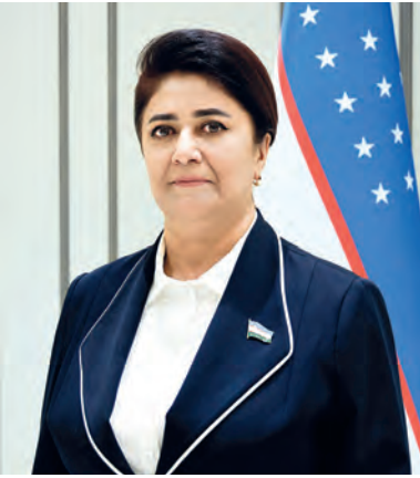
Жамила Бобаназарова. Член Сената Олий Мажлиса Республики Узбекистан.

Обновленная версия Стратегии «Узбекистан - 2030» представляет собой открытый диалог о будущем нашей страны и народа. Усовершенствованный проект программного документа направлен на выведение реформ, запланированных на ближайшие пять лет, на качественно новый уровень. На основе глубокого анализа результатов, достигнутых в последние годы, в стратегии четко определен вектор развития государства на среднесрочную перспективу.