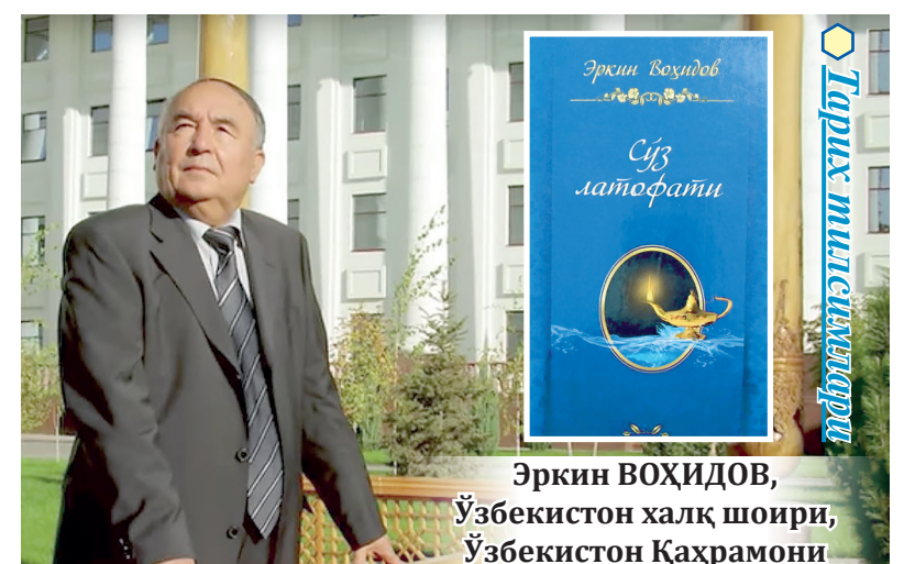
Эркин ВОҲИДОВ, Ўзбекистон халқ шоири, Ўзбекистон Қаҳрамони