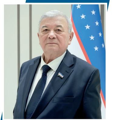
Кутбиддин БУРҲОНОВ, Олий Мажлис Сенати Мудофаа ва хавфсизлик масалалари қўмитаси раиси

Давлатимиз раҳбарининг парламентимиз ва халқимизга Мурожаатномасида белгилаб берилган энг устувор вазифалар ижроси Янги Ўзбекистон тараққиёти, эл-юрт манфаати учун хизмат қилади. Президентимиз таъбири билан айтганда, бу бахтли ҳаёт йўл харитасидир.