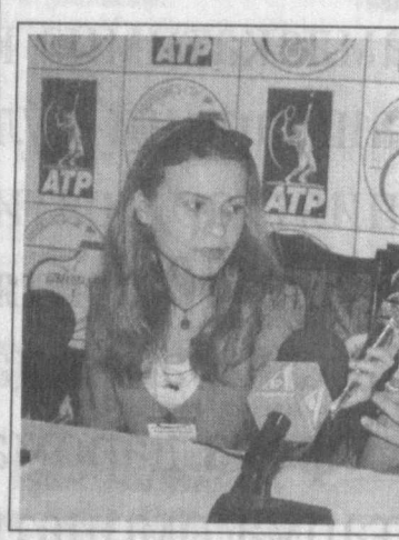
М. Сафиннинг нафақат катта ракетка устаси, балки яхшиги-

Кун кеч бўлиб қолган эди. Шунга қарамай «Юнусобод» теннис кортларига мухлислар оқиб кела бошлади. Беихтиёр мусобақалар жадвалига кўз югуртирамиз. Ҳа, мана энди ҳаммаси равшан. Ҳозир мар-қабат кўрта «Президент кубо-ғи»нинг ўтган йилги соҳи-би Марат Сафин ва Ноам Окуи (Исроил) чиқар экан. Шу учрашув тўғрисида билан эса росси-ялик яна бир теннис юлду-зи Евгений Кафельниковнинг ўйини бошланади.