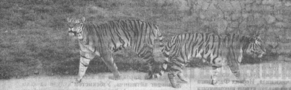
Тоҳиржон ҲАМРОҚУЛОВ олган сурачлар.

СУРАТЛАРДА: ҳайвонот боғидан лавҳалар. Тоҳиржон ҲАМРОҚУЛОВ олган сурачлар.