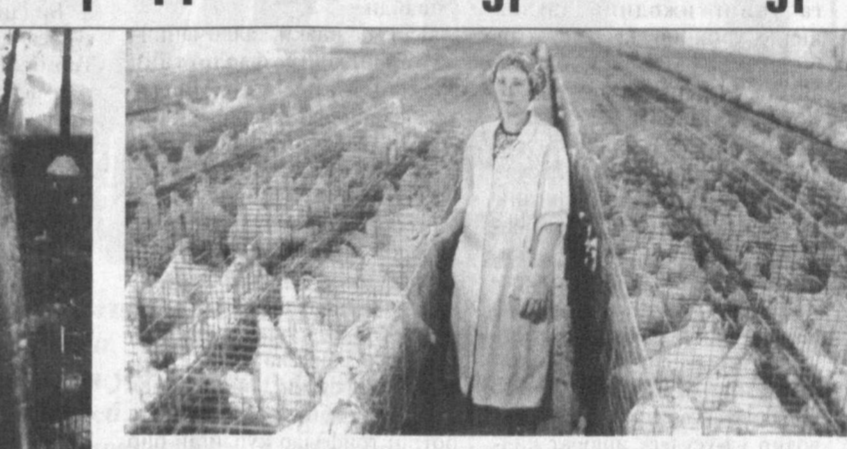
Бир товۇққа ҳам сув, ҳам дон керак, деган ҳикмат бекоорга айтмаган. Шароф Рашидов туманидаги «Бобур» хисдорлик жамияти парранабочарлари буни кўп йиллик тажрибадан яхши билишди.