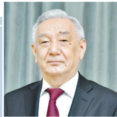
Mirzo Ulug'bek ABDUSALOMOV, Konstitutsiyaviy sud raisi, O'zbekistonda xizmat ko'rsatgan yurist