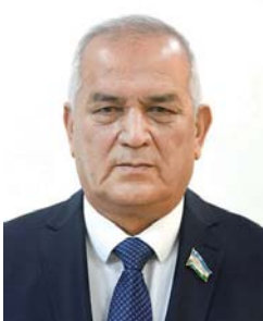
Содиқжон ТУРДИЕВ, член Комитета Сената Олий Мажлиса по аграрным, водохозяйственным вопросам и экологии.

Реализация данного постановления выводит празднование Навруза на новый уровень, превращая его из традиционного торжества в масштабное общественное движение.