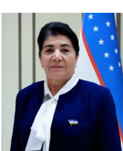
Майра ТОШОВА, член Комитета Сената Олий Мажлиса по судебным вопросам и противодействию коррупции.

Являясь символом мира и согласия, Навруз служит укреплению сплоченности, способствует возвышению общечеловеческих ценностей.