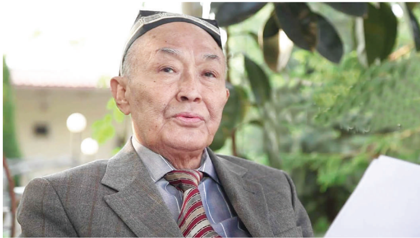
Абдулла ОРИПОВ, Ўзбекистон Қаҳрамони, халқ шоири

Ўзбекистон Республикаси Фанлар академияси Алишер Навоий номидаги давлат адабиёт музейи бўлим мудири, филология фанлари бўйича фалсафа доктори