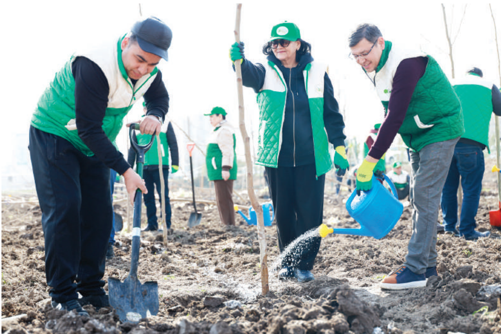
Фототаълим УМУРЗОҚОВА ошган суратлар

Навбахор туманидаги «Юқори Бешрабод» маҳалла фуқаролар йиғини ҳудудида Федерациянинг вилоят кенгаши томонидан икки минг туп бодом дарахти кўчати экилди.