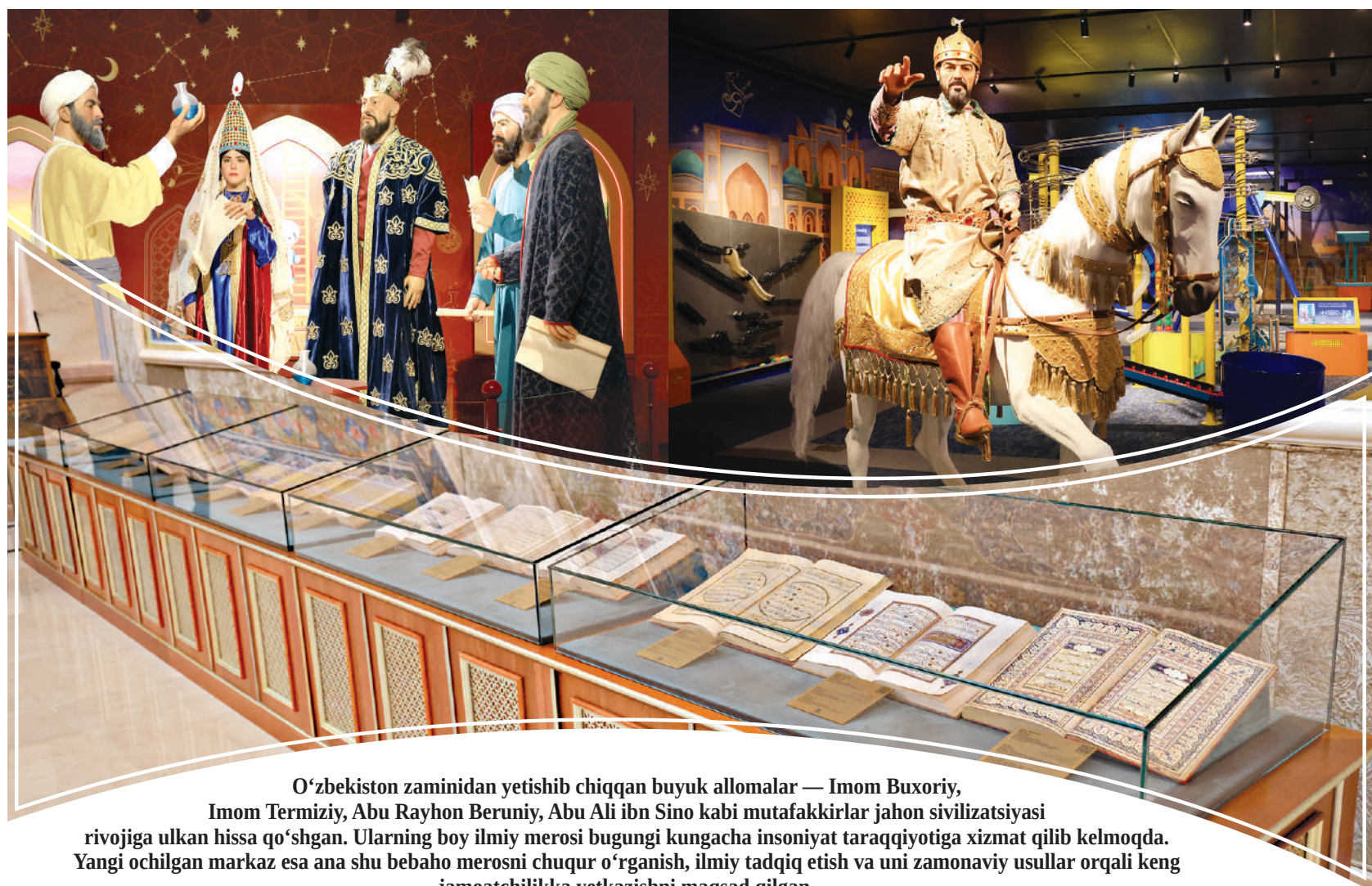
O'zbekiston zaminidan yetishib chiqqan buyuk allomalar — Imom Buxoriy, Imom Termiziy, Abu Rayhon Beruniy, Abu Ali ibn Sino kabi mutafakkirlar jahon sivilizatsiyasi rivojiga ulkan hissa qo'shgan. Ularning boy ilmiy merosi bugungi kungacha insoniyat taraqqiyotiga xizmat qilib kelmoqda. Yangi ochilgan markaz esa ana shu bebaho merosni chuqur o'rganish, ilmiy tadqiq etish va uni zamonaviy usullar orqali keng jamoatchilikka yetkazishni maqsad qilgan.

Ushbu markaz dunyo hamjamiyatiga boy merosimizni namoyon etadigan, uni keng targ'ib qiladigan va millatlararo hamkorlikni mustahkamlaydigan ishonchli ko'priklar bo'lib qoladi.