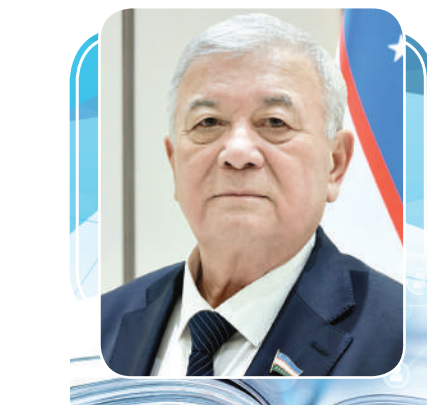
Qutbiddin BURHONOV, Oliy Majlis Senatining Mudofaa va xavfsizlik masalalari qo'mitasi raisi

Bugun jahonda turli qarama-qarshiliklar, tahlikali vaziyatlar kuchayib borayotgan bir sharoitda tinchlik, bag'rikenglik va ma'rifat g'oyalari ilgari surish har qachongidan ham dolzarb ahamiyat kasb etmoqda.