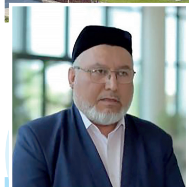
Ҳомиджон ИШМАТБЕКОВ, Ўзбекистон мусулмонлари идораси раисининг биринчи ўринбосари

Байрам кунлари кўча-кўйридан юрганнимизда, олдимиздан чиққан кишиларни таъриқлаб, таниш ёки нотаниш бўлсин, ҳамма билан саломлашамиз. Шу урфимизнинг ўзи билан ҳам жуда катта ажру савобга эришамиз.