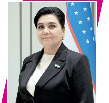
Орзиқул ҚОЗИХОНОВА, Олий Мажлис Сенатининг Ёшлар, хотин-қизлар, маданият ва спорт масалалари қўмитаси раиси