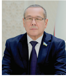
Эзгу ташаббус жажон жамоатчилиги, айниқса, ислом ҳамжамияти томонидан кўралаётган кўмак ва ёрдамларимиз тарихий маънавий меросимизнинг яққол англаш мумкинлиги алоҳида қайди этилди.

Муқаддас Рамазон ойида мамлакатимизда меҳр-оқибат янада кучайиб, эҳтиёжманд инсонларга ҳар томонлама эътибор ҳамда кўмак кўрсатишда, халқимиз эзгу ва савобли амаллари ҳисса қўшапти. Давлат ва нодавлат ташкилотлари, саховатли ҳаюротларимиз томонидан муҳтож оилаларга моддий ва маънавий ёрдам кўрсатилаётгани Ватанимизда файзу баракани ошироққа, инсон қадрининг улуғлигини тинчлик ва умуммиллий бирлик руҳи тобора мустаҳкамлашига асос бўлаётди.