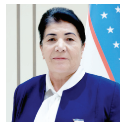
инсоний туйғуларига қувват берувчи, улари яқинлаштирувчи, жишлантирувчи, ягона Ватан туйғусини мустаҳкамловчи бебаҳо омилдир.

Наврўз хайру саховат ишларига чорлайди. Шу кунлари ногиронлиги бор юрдошларимизга, бемору ночор кишиларга саховат кўрсатилади, ҳолидан хабар олинб, имкон даражасида моддий ва маънавий қўллаб-қувватланади. У шунчаки намойиш эмас, балки одамнинг