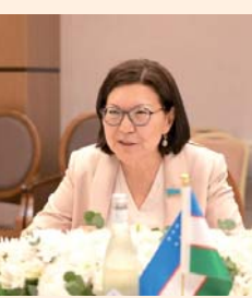
Айгуль Куспан, председатель Комитета по международным делам, обороне и безопасности Мажлиса Парламента Республики Казахстан.

Форум станет площадкой для новых инициатив и практических проектов, заложит основу для регулярного межпарламентского диалога.