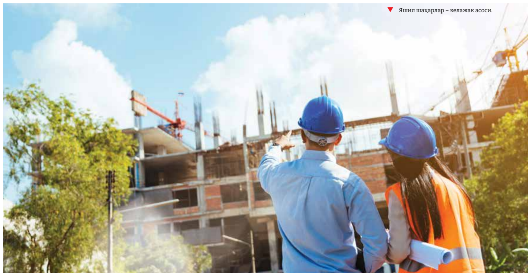
▼ Яшил шаҳарлар – келажак асоси.

ҳудудининг биринчи босқичида бутунги кунга қадар 1 миллионга яқин дарахт кўчатлари экилган. Келгусида яна 2,5 миллион туп дарахт экиш кўзда тутилган. Ҳудудни йирик яшил маконга айлантиришга қаратилган изчил сайё-ҳаракатлар яшил белбоғ концепциясининг муҳим қисмидир.