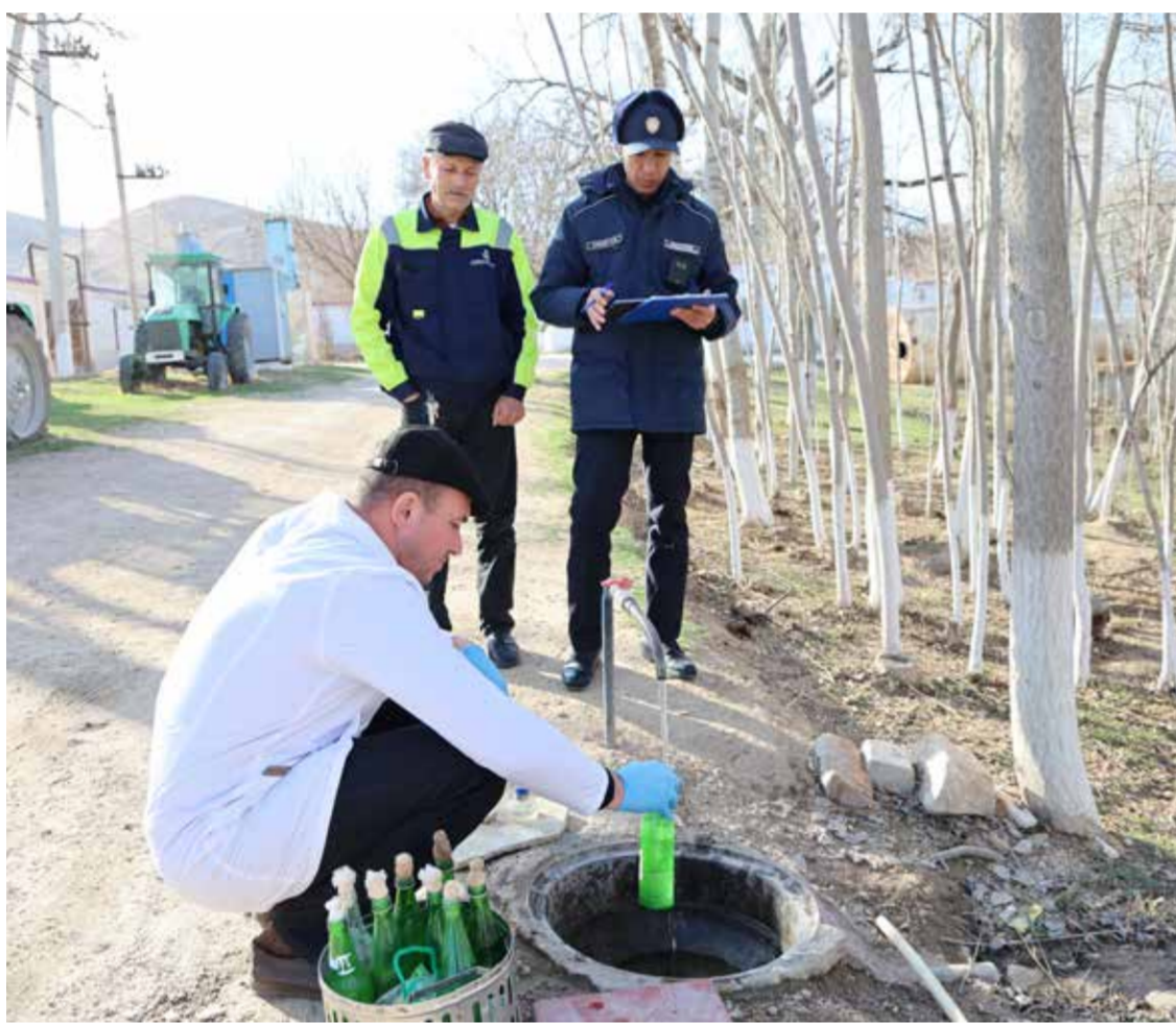
▲ Навоий вилоятида мониторинг ишлари олиб борилмоқда.

Навоий вилояти Қурилиш ва уй-жой коммунал хўжалиги соҳасида ҳудудий назорат қилиш инспекцияси шўъба бош мутахассиси.