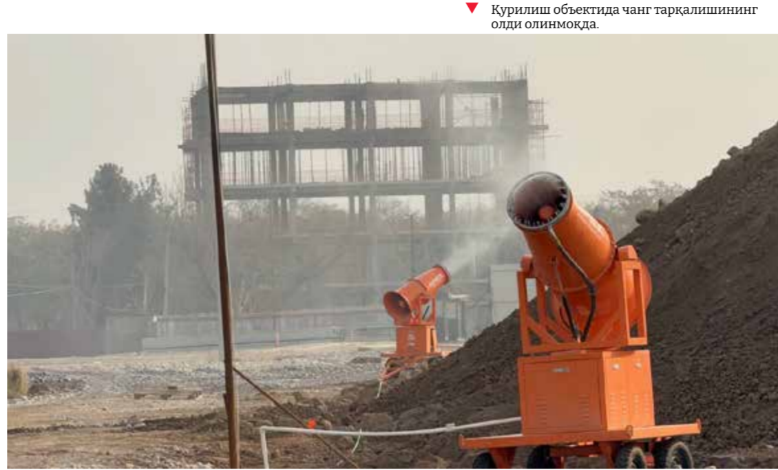
Қурилиш объектида чанг тарқалишининг олди олинмоқда.

Шунингдек, тадбирда “Халқ сўзи” ва “O'zbekiston bunyodkori” газеталари, вилоят телевидениеси журналистлари ҳамда блогерлар ўзларини қизиқтирган саволларга мутахассислардан жавоб олишди.