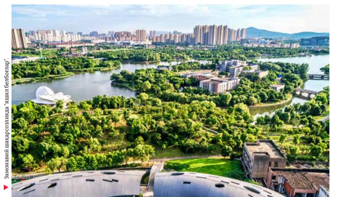
Замонавий шаҳарсозликда “ақли боғи”лар.

Биринчи навбатда, экологик тоза материаллардан фойдаланиш – бу қазиб олиш, ишлаб чиқариш, қўллаш ва утилизация жараёнларида атроф-муҳитга минимал таъсир кўрсатадиган