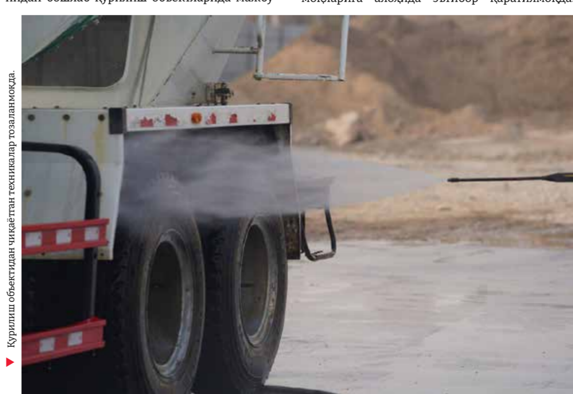
Қурилиш объектидан чиқадиган техникалар тозаланимоқда.

Ҳозирги вақтда “Тоza ҳаво” умуммиллий лойиҳаси доирасида энергетика ва санаот тармоқларига алоҳида эътибор қаратилмоқда.