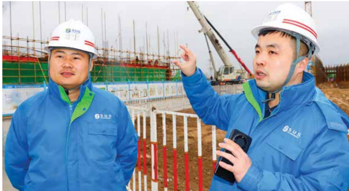
▲ Янги завод барпо этилмоқда.

Шуниси эътиборлики, янги иншоот фойда-ланишга топширилган, 240 миллион КВТ электр энергияси ишлаб чиқариш имконияти пайдо бўлади ва 200 нафарга яқин киши доимий иш билан таъминланади.