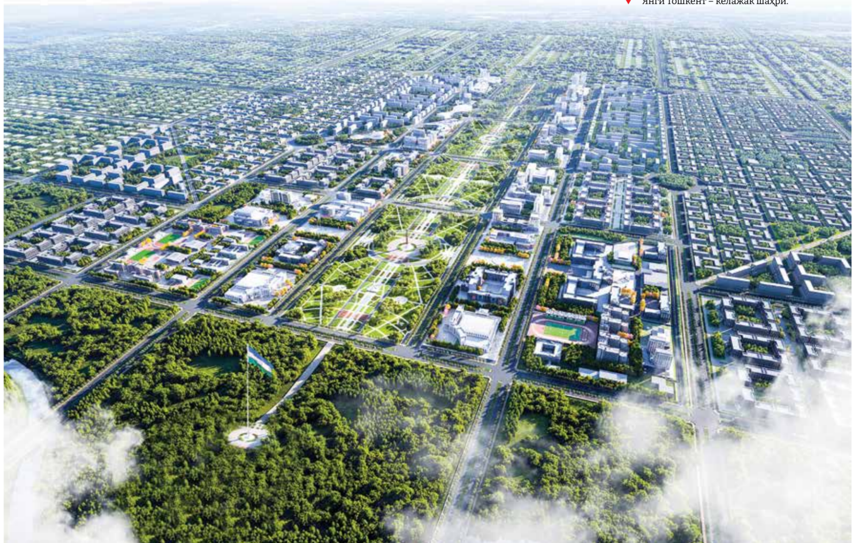
▼ Янги Тошкент – келажак шаҳри.

Бу, албатта, Тошкент ҳамда Янги Тошкент бош режаларида яшил белбоғ дастури устувор мазмун қисмидан далолат беради. Чирчиқ бўйи қирғоқлари ҳам Тошкентга, ҳам Янги Тошкентга киргани учун ҳар томонлама яшил тасма вазифасини бажаради. Шу боис бу ерда бутунга қадар 2000 га яқин дарахт экилди. Бу ишлар Чирчиқ дарёсининг пастки ва юқори оқими бўйича ҳам давом этади. Буларнинг барчаси шаҳар ҳудудида яшил майдонлар кўпайиши ва бу орқали шаҳар ҳавоси тозаланишини таъминлайди.