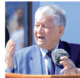
Маҳмуд ТОИР, Ўзбекистон халқ шоири:

Бугунги тинчлик учун, юртимизда яратилаётган шароитлар, халқимиз бахти