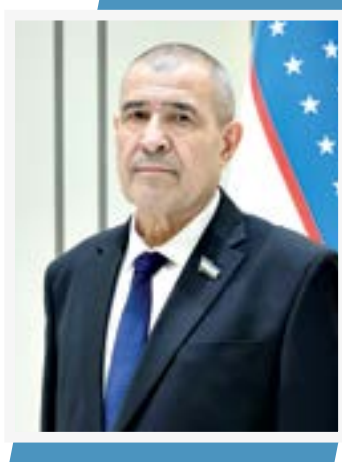
Эркин ГАДОВЕВ, Олий Мажлис Сенатининг Бюджет ва иқтисодий масалалар қўмитаси раиси

Марказий Осиё бугун жаҳон сиёсий ва иқтисодий харитасида тобора муҳим аҳамият касб этаётган ҳудудга айланмоқда. Бундай шароитда қўшни давлатлар ўртасидаги ўзаро ишонч, прагматик ёндашув ва манфаатли ҳамкорлик алоқалари нафақат икки томонлама муносабатлар, балки бутун минтақа барқарорлиги учун ҳал қилувчи омилга айланмоқда. Шу нуқтаи назардан қараганда, Президентимиз раҳбарлигида юритилаётган очик ва конструктив ташқи сиёсат туфайли Ўзбекистоннинг яқин кўшнлари билан муносабатлари мутлақо янги босқичга чиққанини алоҳида таъкидлаш жоиз.