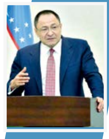
Адхам ИКРОМОВ, спорт вазири