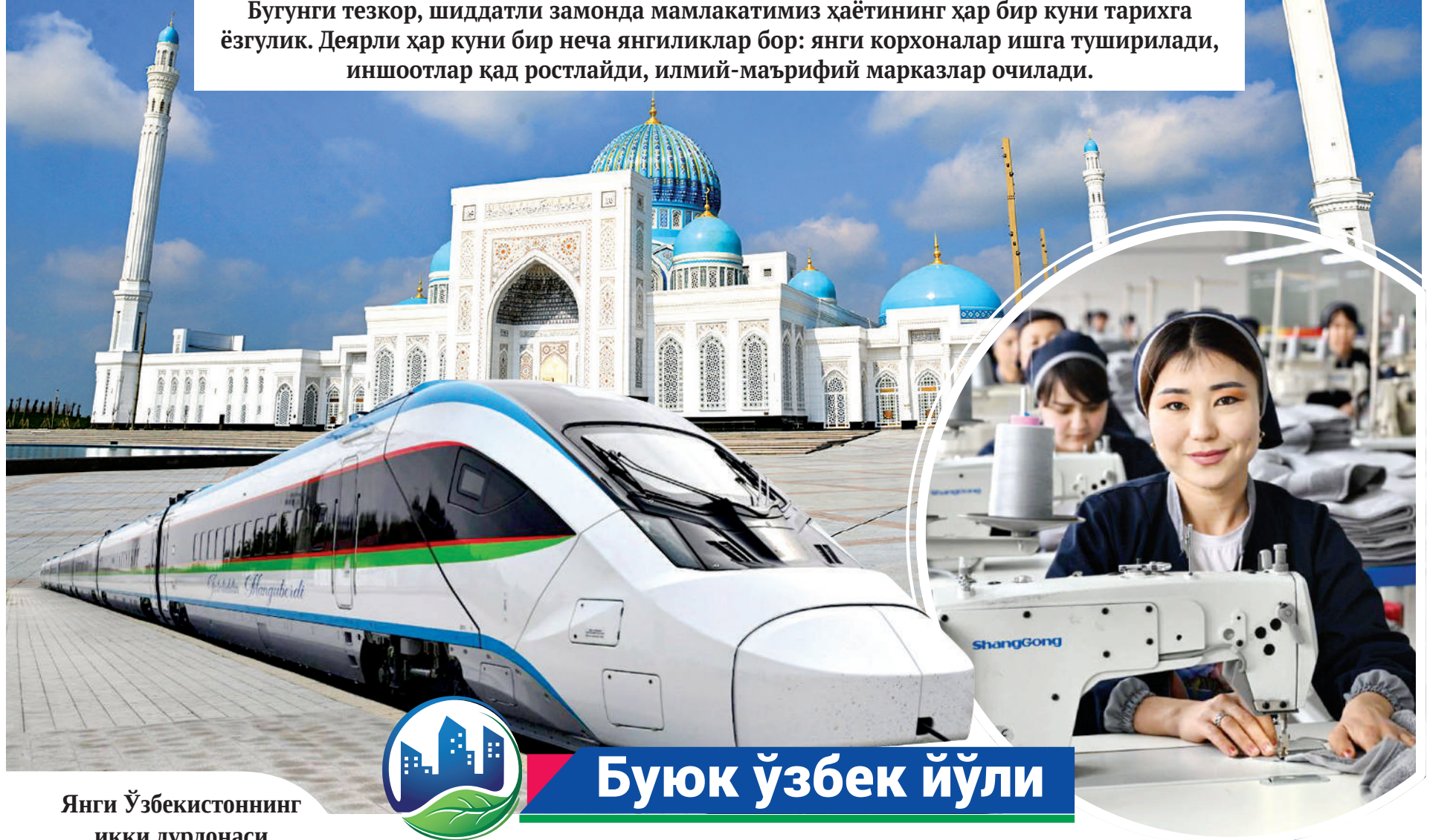
Янги Ўзбекистоннинг икки дурдонаси

Бугунги тезкор, шиддатли замонда мамлакатимиз ҳаётининг ҳар бир куни тарихга ёзгулик. Деярли ҳар куни бир неча янгиликлар бор: янги корхоналар ишга туширилади, иншоотлар қад ростлайди, илмий-маърифий марказлар очилади.