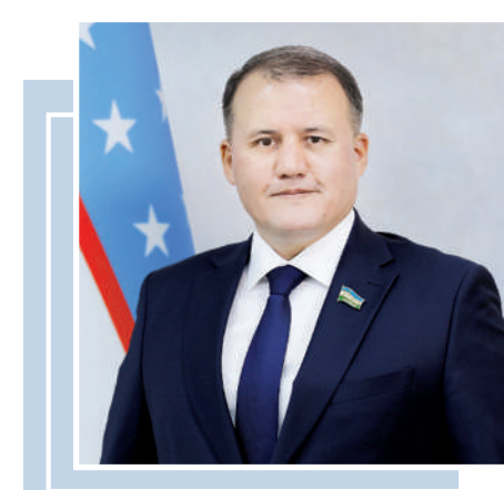
Акрам ҲАЙТОВ, Олий Мажлис Қонунчилик палатаси фракция раҳбари

Музокаралар кун тартибиде савдо-иқтисодий алоқаларни кенгайтириш, саноат кооперациясини чуқурлаштириш ва янги ишлаб чиқариш закирларини яратишга асосий эътибор қаратилади. Бу Ўзбекистоннинг миллий иқтисодиётини модернизация қилиш ва