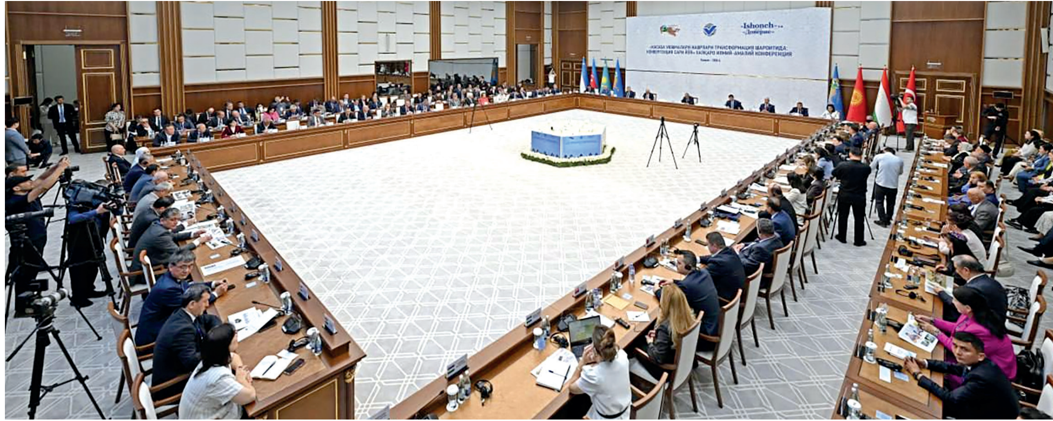
аудитория қизиқиши ва баҳслашиши маданияти ўртасидаги мувоозанатни сақлаш зарур».