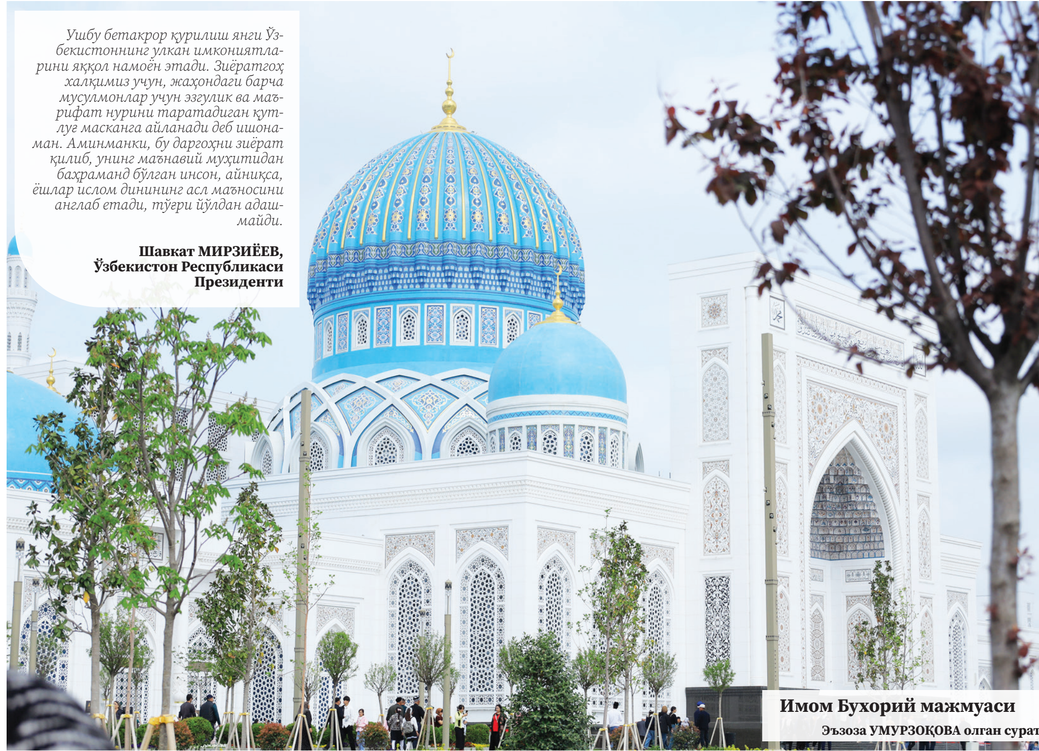
Имом Бухорий мажмуаси

Шавкат МИРЗИЁЕВ, Ўзбекистон Республикаси Президенти