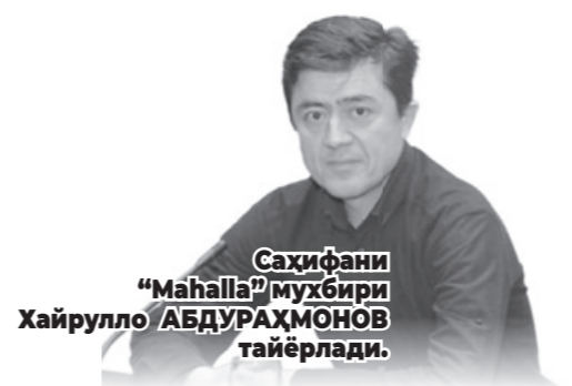
Саҳифани “Ma'halla” муҳбири Хайрулло АБДУРАҲМОНОВ тайёрлади.

Келгуси режалар янада улкан. Норасмий секторда ишлаётганларни расмий банд қилиш, уларни ижтимоий ҳимоялаш борасидаги ишлар изчил давом эттирилади. Тўғри, сўнгги йилларда ишсизлар сони кескин қисқарди. Аммо бу — бизни қаноатлантирмайди. Асосий мақсад — одамлар иш қидириб эмас, тадбиркорлар ишчи қидириб юришига эришиш.