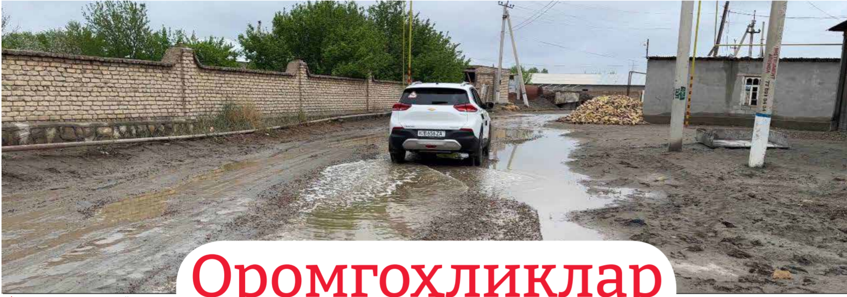
▲ Жондор туманида жойлашган "Пўлоти" маҳалла фуқаролар йиғини ҳудуддаги айрим ички йўлларнинг бугунги ҳолати.