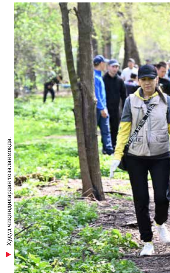
Ҳудуд чиқиндилардан тозаланамоқда.

Тошкент шаҳар ҳокимлиги чиқиндилар билан ишлаш масаласига фақат коммунал хизмат вазифаси сифатида эмас, балки экология, замонавий шаҳар бошқаруви ва фуқаролик мадания-тининг муҳим йўналиши сифатида қарайди. Шу мақсадда пойтахтда чиқиндиларни бошқариш жараёнларини рақамлаштириш бўйича "Тоза Пойтахт" тизими жорий этилган. Мазкур тизим орқали чиқинди ташувчи махсус техникалар ҳаракати, уларга бириктирилган ҳудудлар, давлат рақамлари ҳамда ҳар бир ҳудуд бўйича чиқинди олиб кетиш кунларини кузатиш имконияти яратилган.