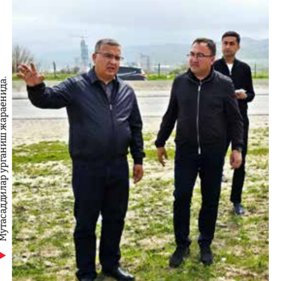
Мутасаддилар ўрганиш жараёнида.

Бундан ташқари, Оқдарё туманида Маҳдуми Аъзам зиёратгоҳига туташ ҳудудда барпо этилган ерости пидедалар йўлаги қўздан кечирилди. Мазкур ишоот пидедалар ҳаракати хавфсизлигини таъминлаш ва қулайлик яратишда муҳим аҳамиятга эга экани қайд этилди.