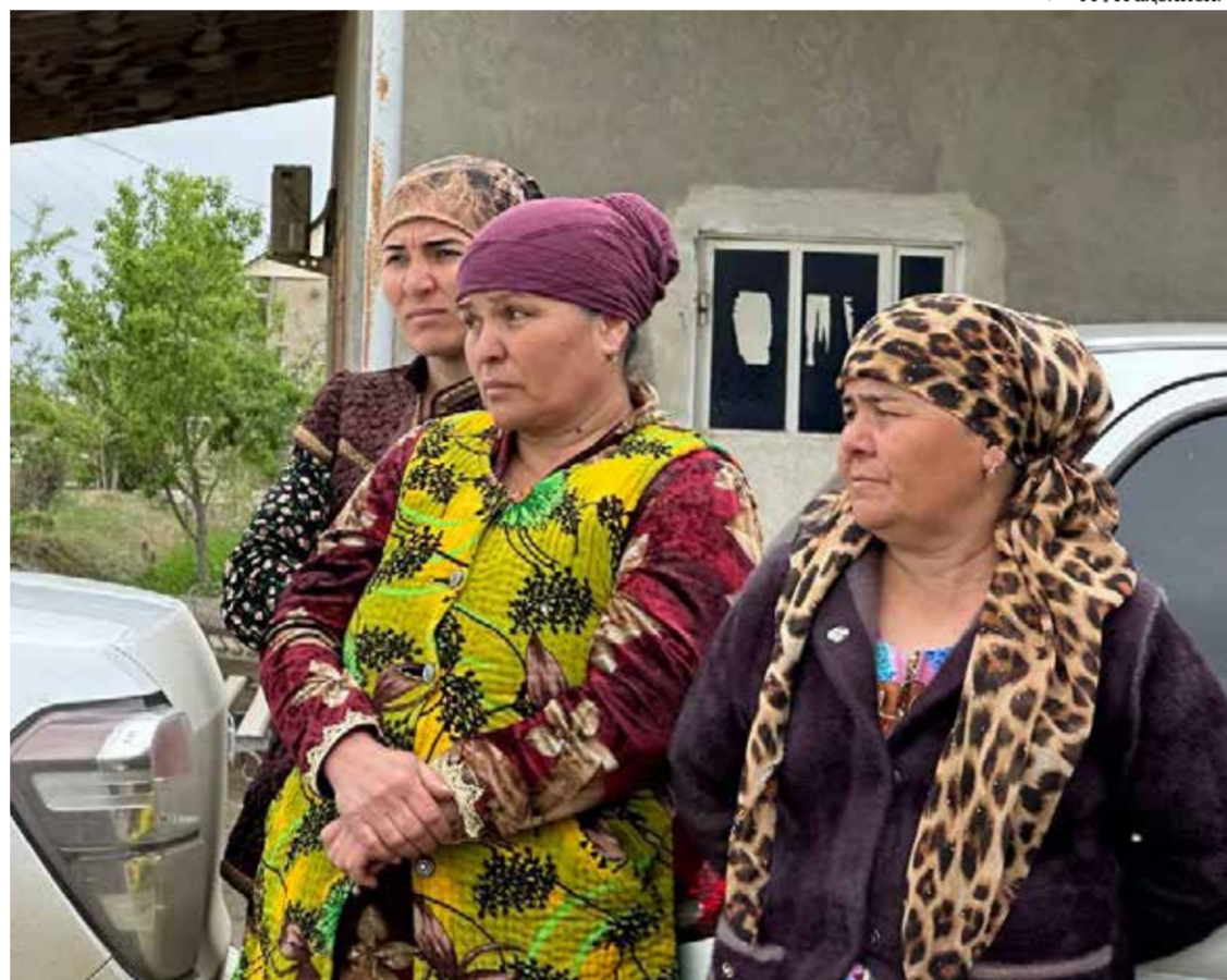
▼ МФЙ аҳолиси.

Бундай ҳолатлар ҳудудда тез-тез такрорланиши аҳолининг хавотирини анча кучайтириб қўйган. Йўл инфратузилмасининг ёмонлиги ҳайдовчи ва йўловчи ўртасидаги тушунмовчиликларга, аҳолининг қайфияти тушишига олиб келади. Айниқса, ёш болаларнинг соғлиги хавф остида қолаётгани масаланинг қанчалик жиддий эканини кўрсатади. Чанг ва кум тўзонлари эса ҳудуднинг яна бир оғриқли нуқтасидир. Бундай ҳаво аллақачон турли касалликлар ва аллергия муаммоларини пайдо қилган. Аҳолининг айтишича, ушбу касалликлар туфайли ёши катталар тез-тез даволаниб туришга мажбур бўлишмоқда.