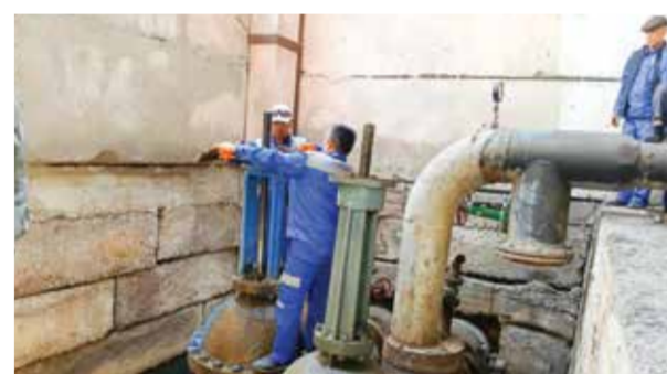
▲ Ангренда иссиқ сув муаммоси ҳал этилди.