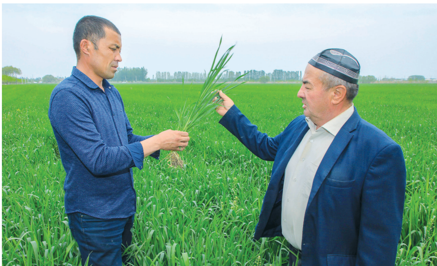
Суратгир: М. ҚОДИРОВ (ЎЗА).

Соли ҷорӣ дар панҷ ҳазор гектар замин ноҳияи Олтиариқи вилояти Фарғона парвариши пахта ба нақша гирифта шудааст. Дар 1600 гектари он мувофиқи таъриҳи Шинҷон – Ҷуғур пахта рӯида мешавад. Ҳоло дар ноҳия қорҳои киштани тухмӣ амалӣ мешаванд, аз ҷумла дар 30 гектар майдони хоҷагии фермерии «Диёр Олтинобод» пахта дар зери плёнка парвариш қарда мешавад. Тавре ки масъулони хоҷагии фермерӣ таъкид мекунанд, ин усули қор барои истифодаи босамари захираҳои об ва техника имкон медиҳад. Ба қорҳои додани хароҷот ва кам қардани меҳнати дастӣ мусоидат менамояд. Дар хоҷагии парвариши киштзори хушадор дар 30 гектар замин низ хуб аст.