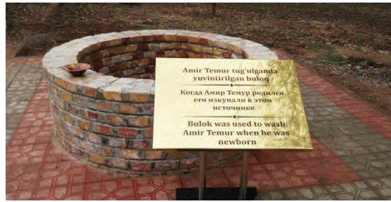
Amir Temur tug'ilganda yuvintirilgan buloq.