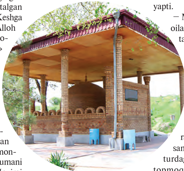
Xo'ja Ilg'or nomi bilan tanilgan Xo'ja Muhammad ibn al Qosim maqbarasi.

birorta bekor yurgan odamni ko'rmaysiz. Har bir fuqaro bir qarich bo'lsin yerda dehqonchilik qiladi. O't-o'lanidan chorvasiga ozuqa to'playdi yoki tadbirkorlik bilan band.