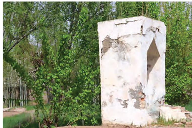
Ushbu masjidni Amir Temur otasi barpo etgan.