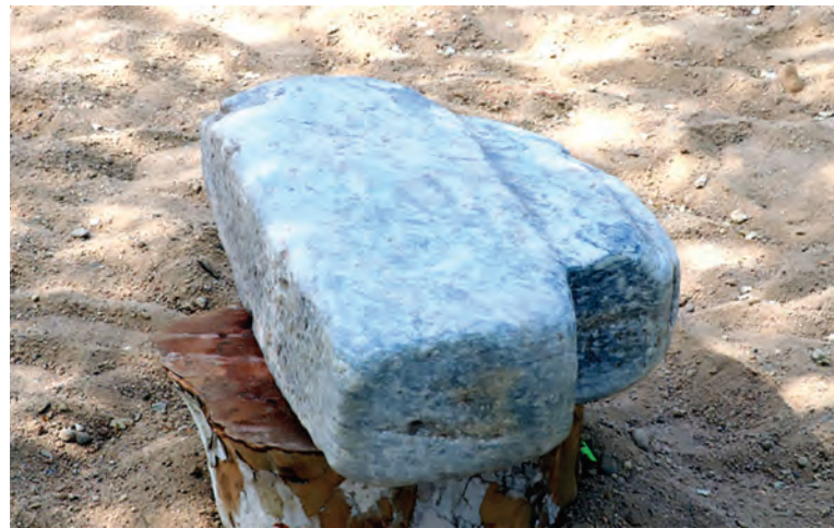
Amir Temur ko'tarib mashq qilgan polvontosh.