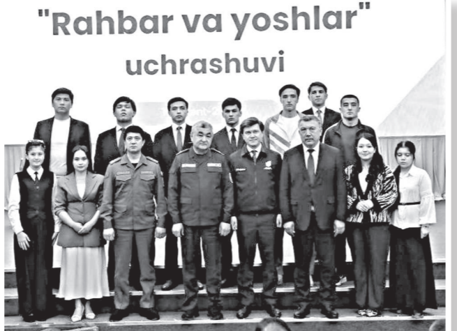
"Rahbar va yoshlar" uchrashuvi