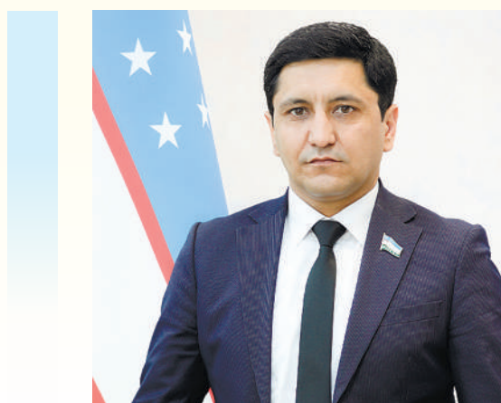
Жасур ЖУМАЕВ, Олий Мажлис Қонунчилик палатаси депутати, O'zLiDeP фракцияси аъзоси

Ҳужжат давлат сиёсати, жамоатчилик иштироки ва тадбиркорлик ташаббусини бир нуқтада бирлаштиради. Дарвоқе, ушбу ташаббус жамиятга шунчаки ёрдам беришни эмас, балки бирга яшаш, бирга масъул бўлиш ва бирга тараққиёт этиш ғоясини сингдиради. Ана шу жиҳати билан ҳам замонавий Ўзбекистон ижтимоий ҳаётида катта маънавий ва амалий аҳамият касб этувчи дастур сифатида юксак баҳога лойиқдир.