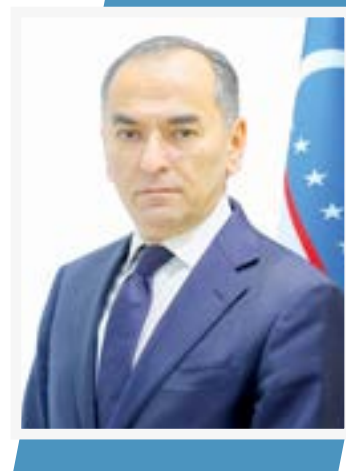
Xurram TESHABOYEV, investitsiyalar, sanoat va savdo vaziri o'rinbosari

2025-yil yakunlari ushbu yo'nalishdagi ishlohtlarning amaliy natijalarini yaqqol namoyon etdi. Xususan, respublika eksporti 2025-yili oltinsiz hisobda 23,9 milliard dollarni tashkil etib, 2024-yildagiga nisbatan 122 foiz o'sdi.