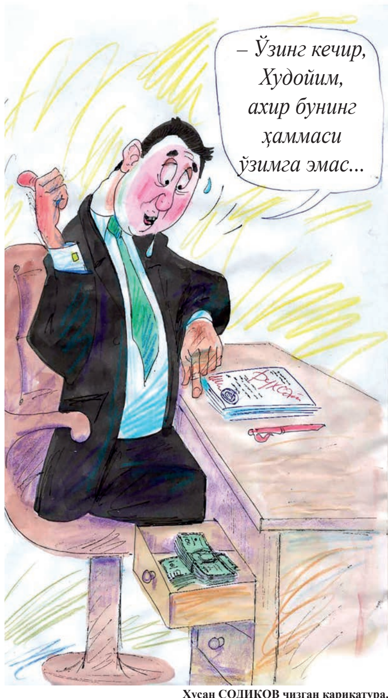
Ҳусан СОДИҚОВ чизган карикатура.