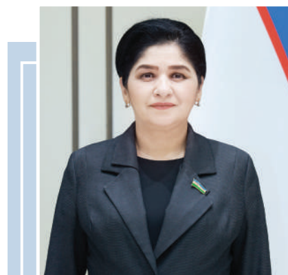
Малика ҚОДИРХОНОВА, сенатор

Бу ҳужжатни сўнгги йилларда мамлакатда спорт соҳасидаги кенг қўламли ишловларнинг мантқий якуни, айни пайтда эса янги бошқичининг ҳуқуқий пойдевори сифатида баҳолаш мумкин. Чунки амалиёт яққол кўрсатдики, спортни ривожлантириш фақат алоҳида қарор, дастур ёки мусобақалар билан эмас, балки яқин ва пухта ўйланган ҳуқуқий тизим орқали таъминланади. Янги қонун айнан шу эҳтиёждан келиб чиққан ҳолда ишлаб чиқилди.