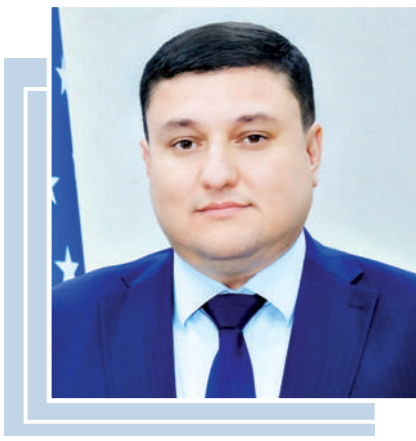
Нодирбек САЙФУЛЛАЕВ, Ўзбекистон давлат санъат ва маданият институти ректори, профессор

Жисмоний тарбия ва спорт соҳасидаги устувор вазифалар юзасидан ўтказилган видеоселектор йиғилишида Президентимиз илгари сурган кўплаб ташаббуслар соҳада мутлақо янги бошқарув ва ташкилий механизмларни жорий этишга қаратилгани билан аҳамиятли.