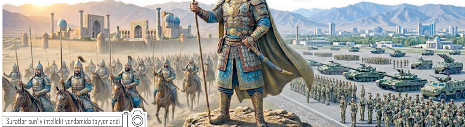
Suratlar sun'iy intellekt yordamida tayyorlandi

Tantanalik kuzatish marosimlari, mashg'ulotlar va saf parادلari harbiy ruhni mustahkamlaydi va yoshlarni sohibqiron qadriyatlarini bilan uyg'unlashtiradi.