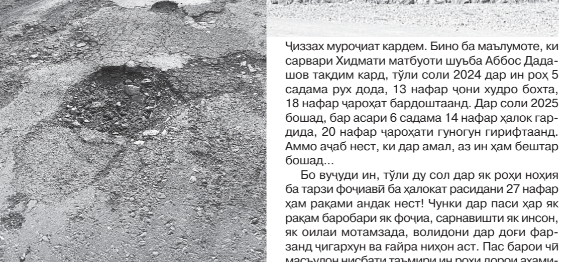
Ҳам вақт талаф мешавад ҳам асаб хароб...

Дар ҳақикат, вазъи хароби роҳ, аз ҷумла, ҳолати техникӣ, фарсудашавии рўйишӣ асфалт, ҷуқуриҳо, ноҳамворӣ, ноаён будани хатҳо, аломатгузориҳои нокифоя – бо як суҳан ба меъёри роҳсозӣ ҷавобгў набудани роҳ, на танҳо ба суръати ҳаракат таъсир мекунанд, балки дар ҳақде хавфи садамаҳоро низ зиёд менамоянд. Бино ба оморӣ байналмилалӣ, дар кишварҳои дар ҳоли рушд қариб 20-30 дарсади садамаҳо ба ҳолати роҳи вобастаанд. Саволи барҳақ пайдо мешавад: вазъи хароби роҳи Фориш ба ҳаракати мошинҳо чӣ гуна таъсир мерасонад? Тўли солҳои охир дар ин роҳ чӣ қадар садама рух дод ва боиси ҳалокати чанд нафар гардид?