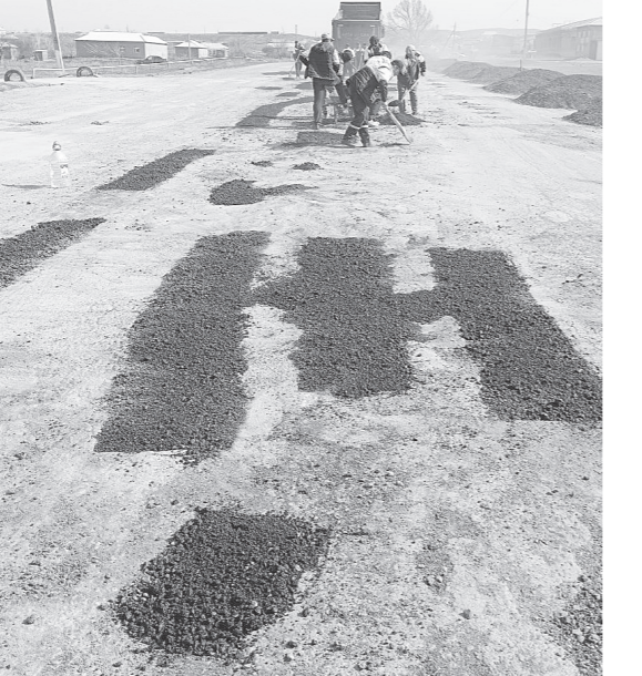
Дар фармон ҳаст, аммо...

Аз ин рӯ, онҳое, ки то ҳол дар ин масир ҳаракат накардаанд, вале ниёти боздид аз деҳаҳои зебоманзари қаторкӯҳҳои Нурато доранд, ҳуб мешуд, пеш аз сафар вазъи мошини худро бодикқат санҷанд, чарҳи эҳтиётро бо худ гиранд, қуттии тиббиери аз назар гузаронанд ва барои ҳар эҳтимол ягон доруи асаб ва фишорбаландиро ҳам дар ҷайб андозанд. Зеро дар қисми асосии роҳи Фориш, ки аз баромадгоҳи ин ноҳия то ҳудуди вилояти Навой тӯи қашидааст, бо амал ба шори «эй сорбон, оҳиста рон!» танҳо бо суръати 30-40 километр дар як соат ҳаракат кардан мумкин аст. Агар камтар суръат баланд шавад ё ронанда андак бепарвой намојд, мошин ё ба «яма» меафтад, ё ки аз роҳ берун мешавад, ё ин ки бо мошини дигар «лаб ба лаб» мезанад. Ин на ташбеҳ асту на муболиға – воқеияти ҳаррӯзаи ин роҳ аст. Беҳуда нест, ки мардуми маҳаллӣ онро гоҳе «роҳи хунҷур» низ меноманд ва бо алам меғунанд: «дар ҳар садамаи ин роҳ ағлаб қони касе аз даст меравад...»