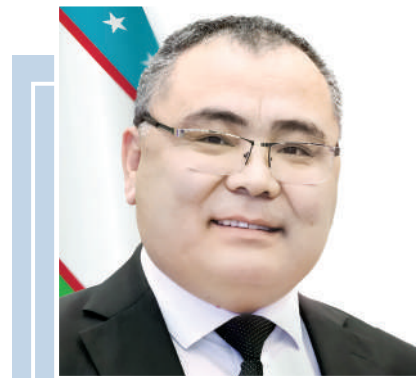
Ibrohim ABDURAHMONOV, qishloq xo'jaligi vaziri, akademik